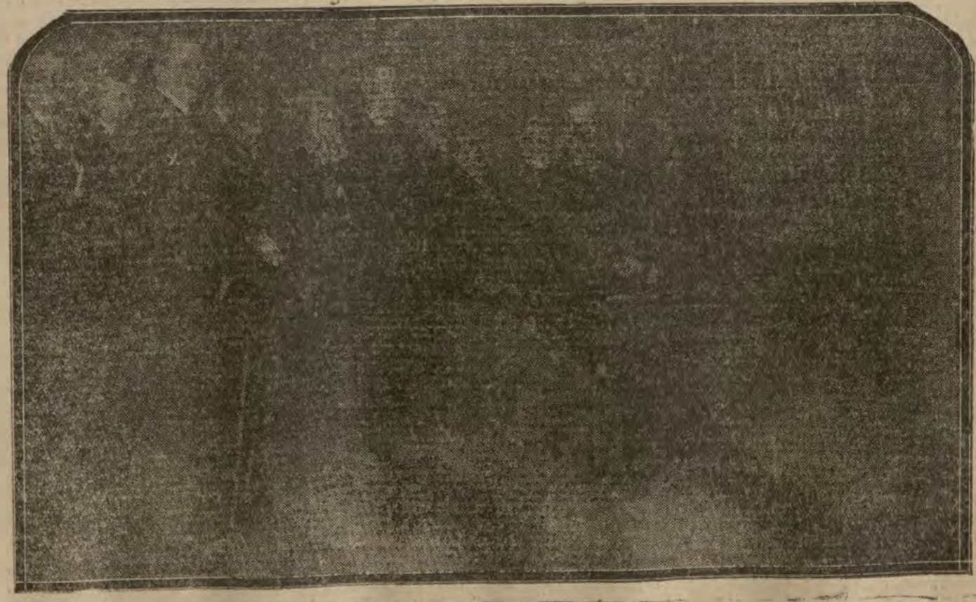
MADRID.—Don Alfonso XIII, visitando el Salón de Otoño

REAL CINEMA Y PRINCIPE ALFONSO Viernes, sábado y domingo, sensacionalísimo estreno LA PRINCESA JORGE según la célebre obra de Alejandro Dumas, interpretada por FRANCESCA BERTINI (Programa Unión)