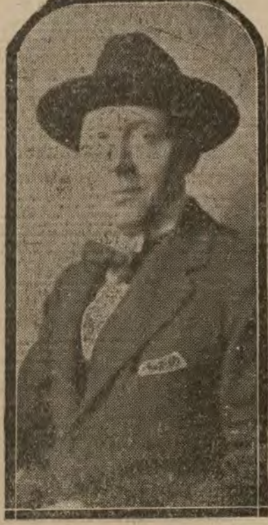
MADRID.—El original e interesante pintor Gustavo de Maeztu, que ha triunfado plenamente en el salón de Otoño