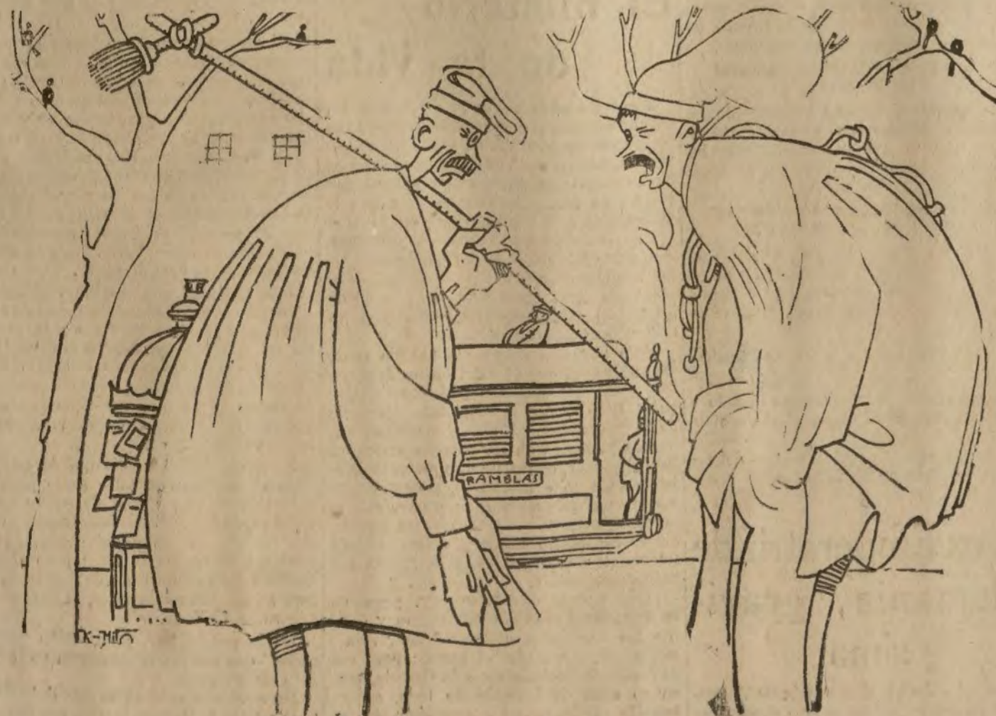
LA VIDA EN BARCELONA

— Que si la banda roja, que si la banda blanca, lo cierto es que aquí vive uno de carambola. — Sí; de carambola por bandas.