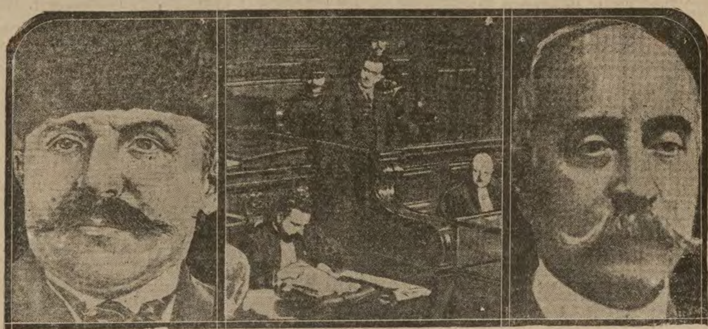
PARIS.—El proceso de espionaje de Essad Baja.—1 Essad Baja, jefe del Gobierno albanés, asesinado.—2 El estudiante albanés Aveni Rusten, ante el Tribunal.—3 El almirante griego Coundouriotis, cuya candidatura se indica para el trono de Albania