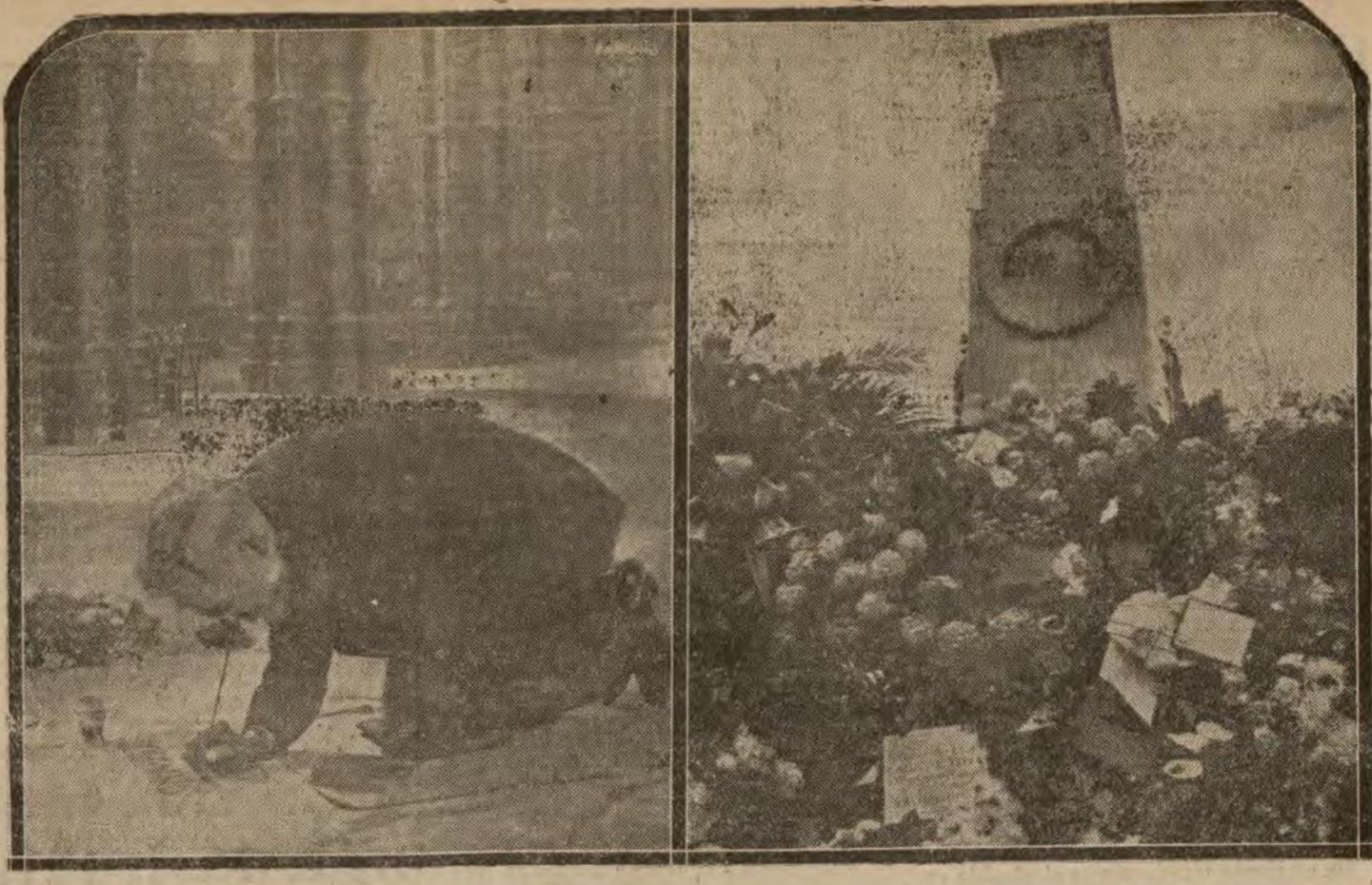
LONDRES.—La tumba del soldado anónimo. La inscripción sobre la tumba de la Abadía de Wensmister. Uno de los aspectos del cenotafio, donde depositó flores y coronas todo el pueblo inglés

JOVEN conociendo oficinas, comercio, traba- jería seis horas mañana. Oferta: Adm. nistración este diario.