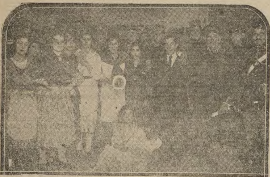
SAN SEBASTIAN.—Grupo de actores en la velada de los artilleros que se celebró en el teatro Victoria Eugenia el día de Santa Bárbara.

EL ANUNCIO MAS PRODUCTIVO ES EL DE LA VALLA ANUNCIADORA de las calles ALCALA y SEVILLA Palacio en construcción del BANCO DE BILBAO Más de 200,000 personas lo leen diariamente Concesionario: P. MARTINEZ OROZCO Plaza de Catalujas 6, primero