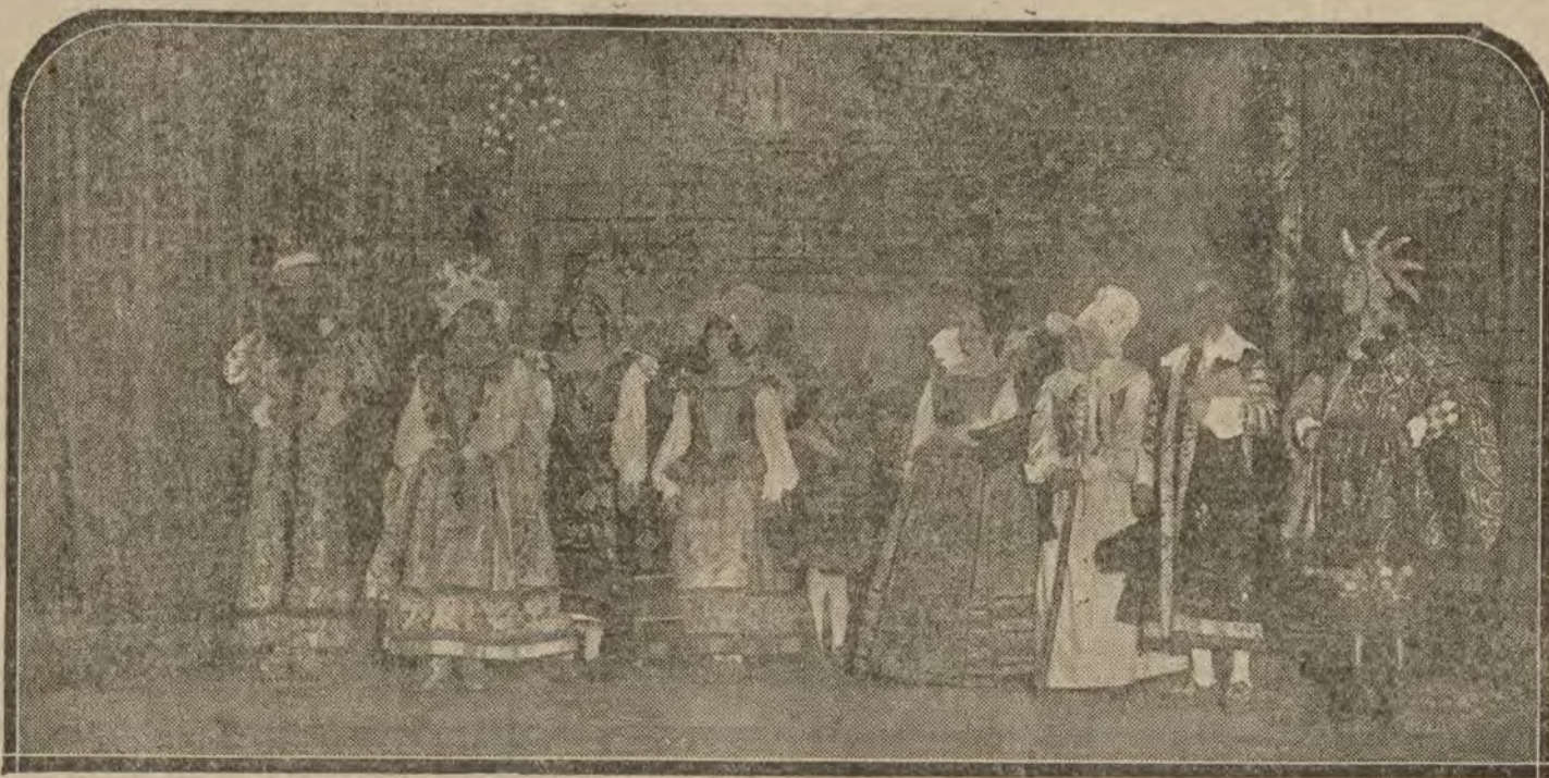
MADRID.—«El Príncipe que todo lo aprendió en los libros», que se reprisé anoche en el teatro Español