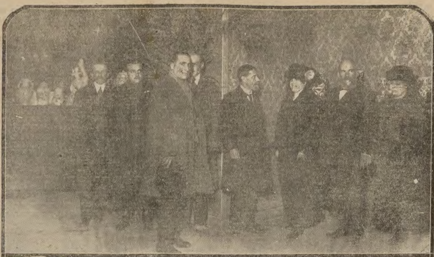
MADRID.—Exposición de Cerámica, de Toledo, en el salón del Círculo de Bellas Artes

Comerciantes, Industriales, HOY anuncian ustedes en PIDAN TARIFAS DE PUBLICIDAD