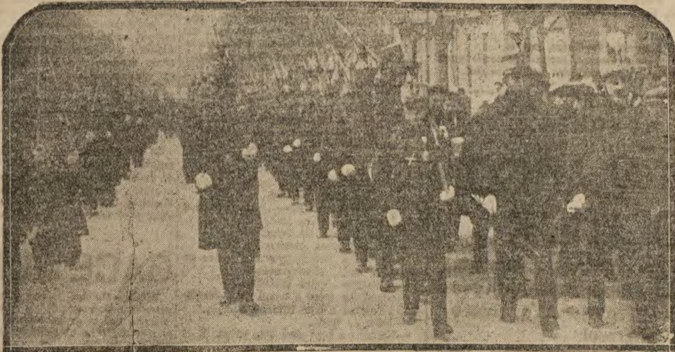
El Príncipe de Asturias con su Regimiento al salir de los Jerónimos

Sus orígenes. Las primeras luchas del hombre con el hombre. En la Edad Media. Los ejércitos permanentes. Los tercios españoles. En los cuarteles.