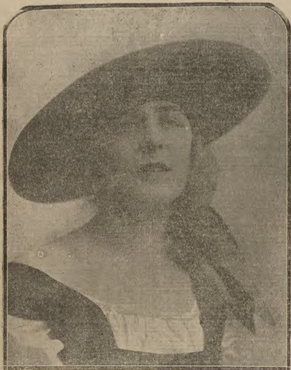
MADRID.—Carmen Fuentes, bella y notable artista de varietés que en breve debutará en el teatro Roma.