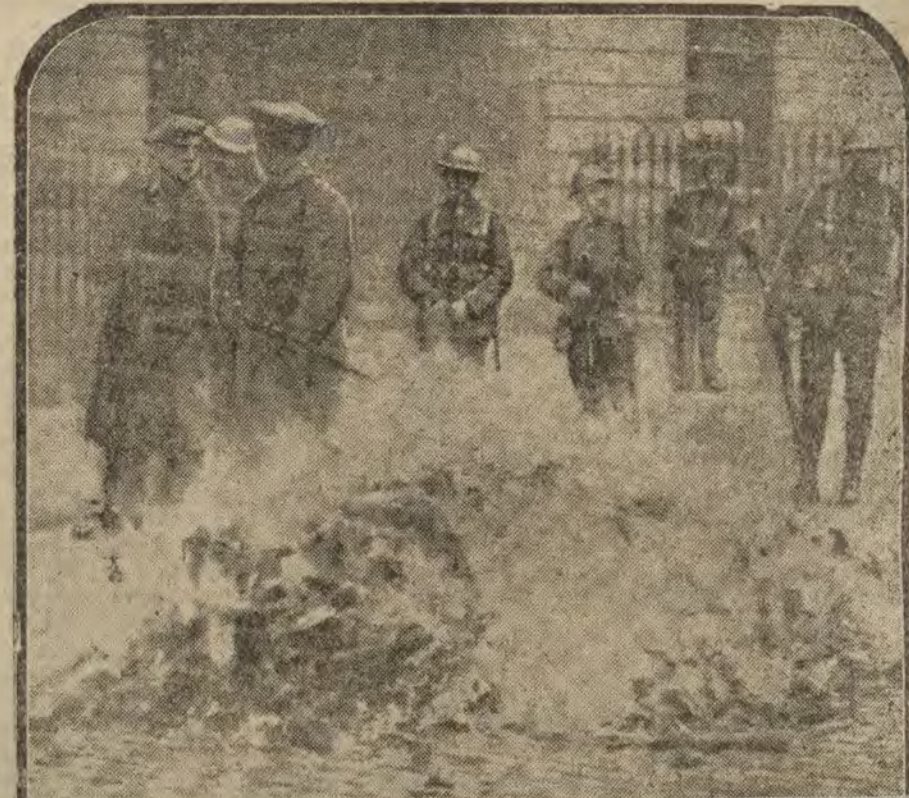
IRLANDA.—En auto de fe en las calles de Dublín. Los gendarmes quemando en la calle los libros y folletos revolucionarios hallados en un «raid» contra los «sinnfeiners»

Pendientes novedad. Sortijas sello. Relojes pulsera, desde 11,75. Especialidades de "El Norte". HORTALEZA, 140.