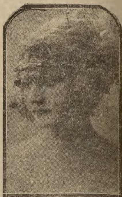
PARIS.—Los tocados nocturnos. Vuelven las diademas y joyas. Una corona de plata labrada, con colgantes de perlas negras.