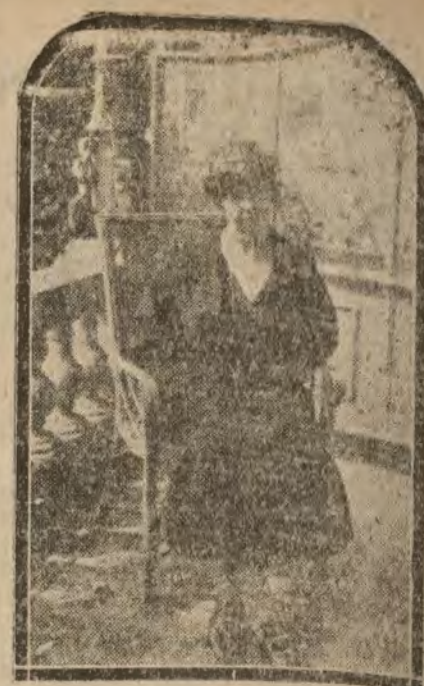
GRECIA.—La esposa del Rey Constantino