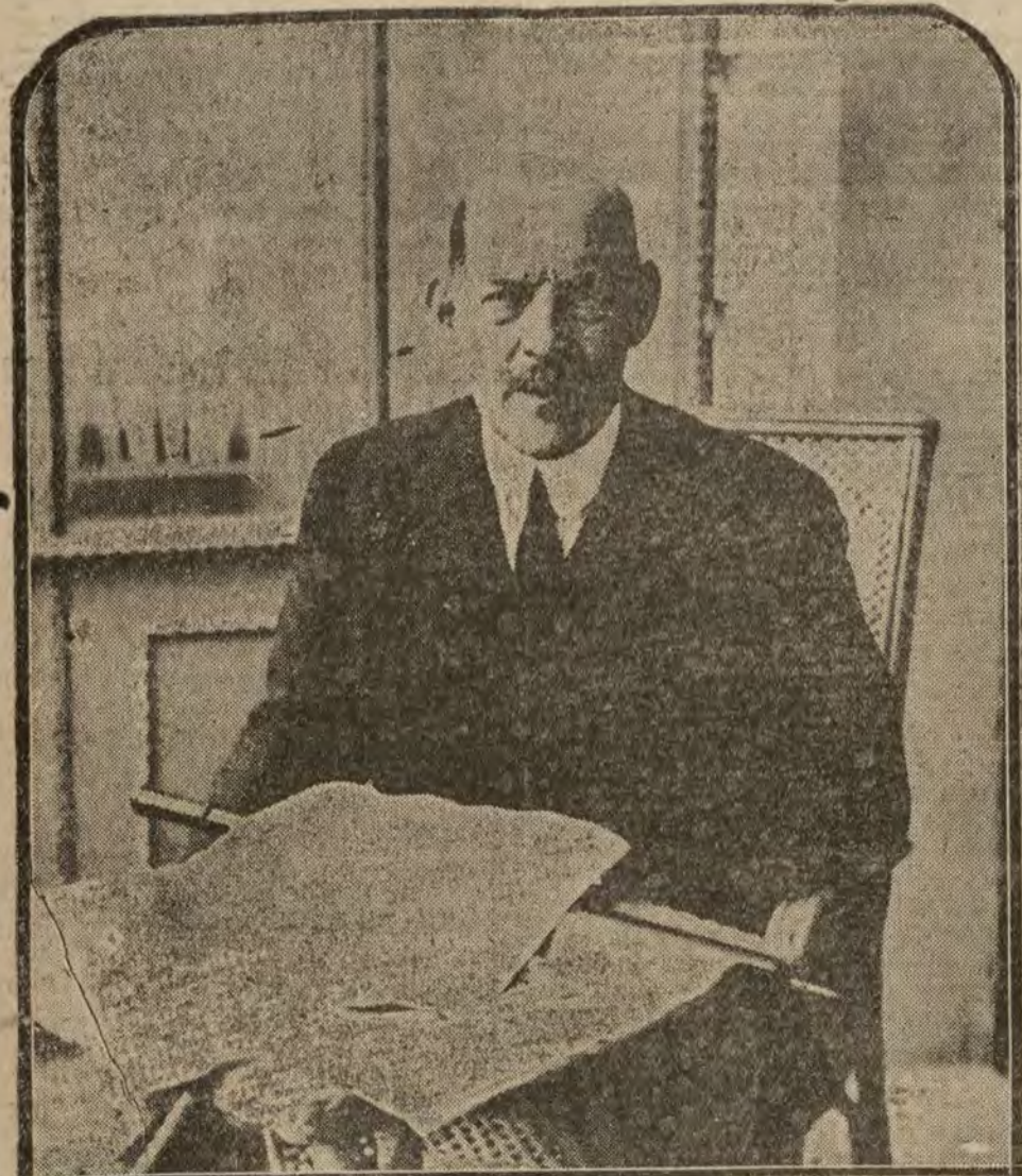
GRECIA.—Ultimo retrato del Rey Constantino