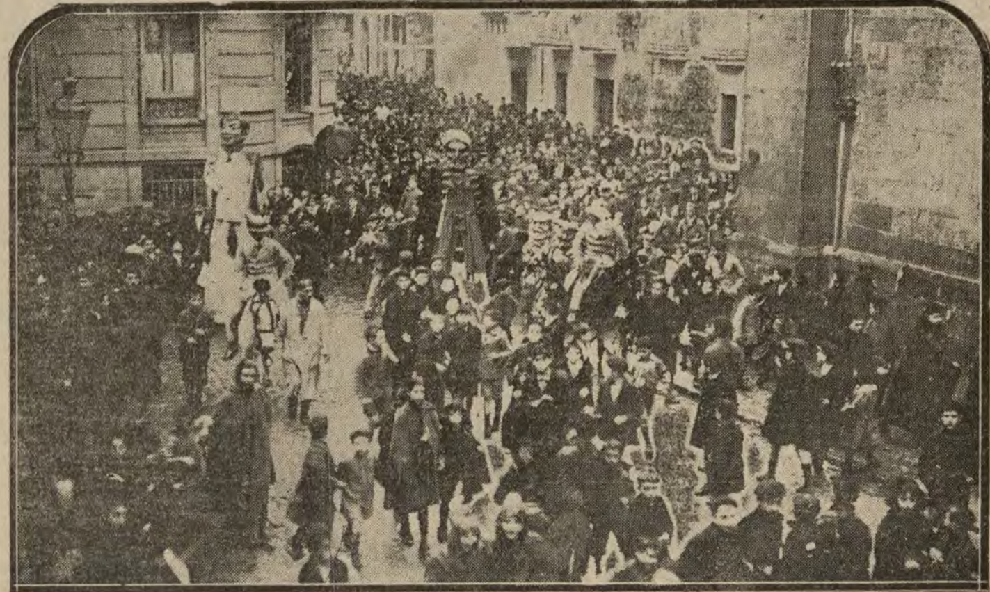
SAN SEBASTIAN.—La cabeigata organizada con motivo de la fiesta de la Infantería, recorriendo las calles.

Joyería Moderna ULTIMAS NOVEDADES PARA REGALO Montera, 21