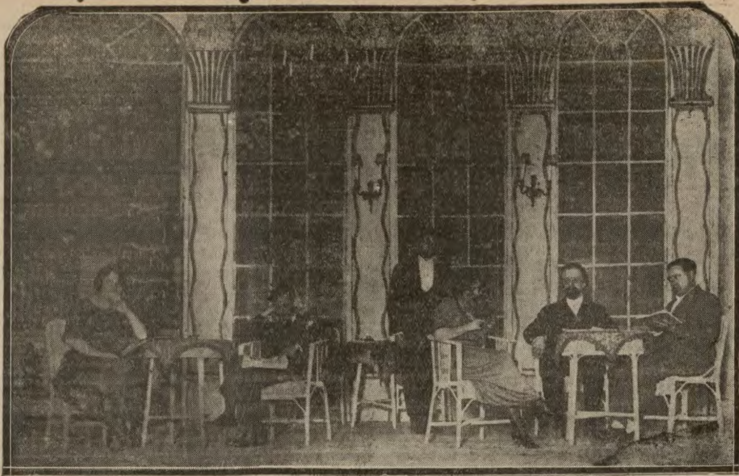
MADRID.—Una escena del primer acto de «La mujer fatal», comedia estrenada anoche con éxito en Eslava.