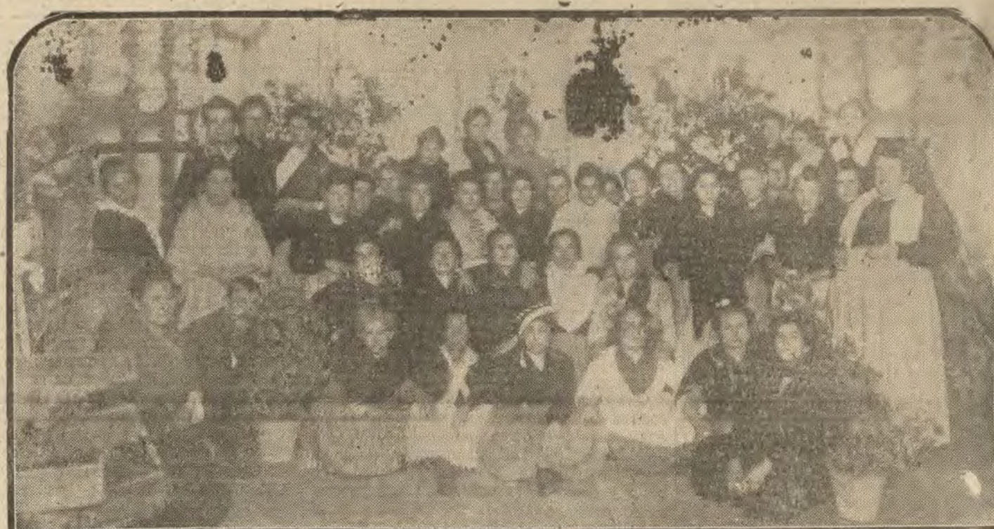
SEVILLA.—Grupo de cigarreras festejando la fiesta de la Patrona

SASTRERIA RIAZA. Contado, plazos, ocho meses. CORREDERA, 45.