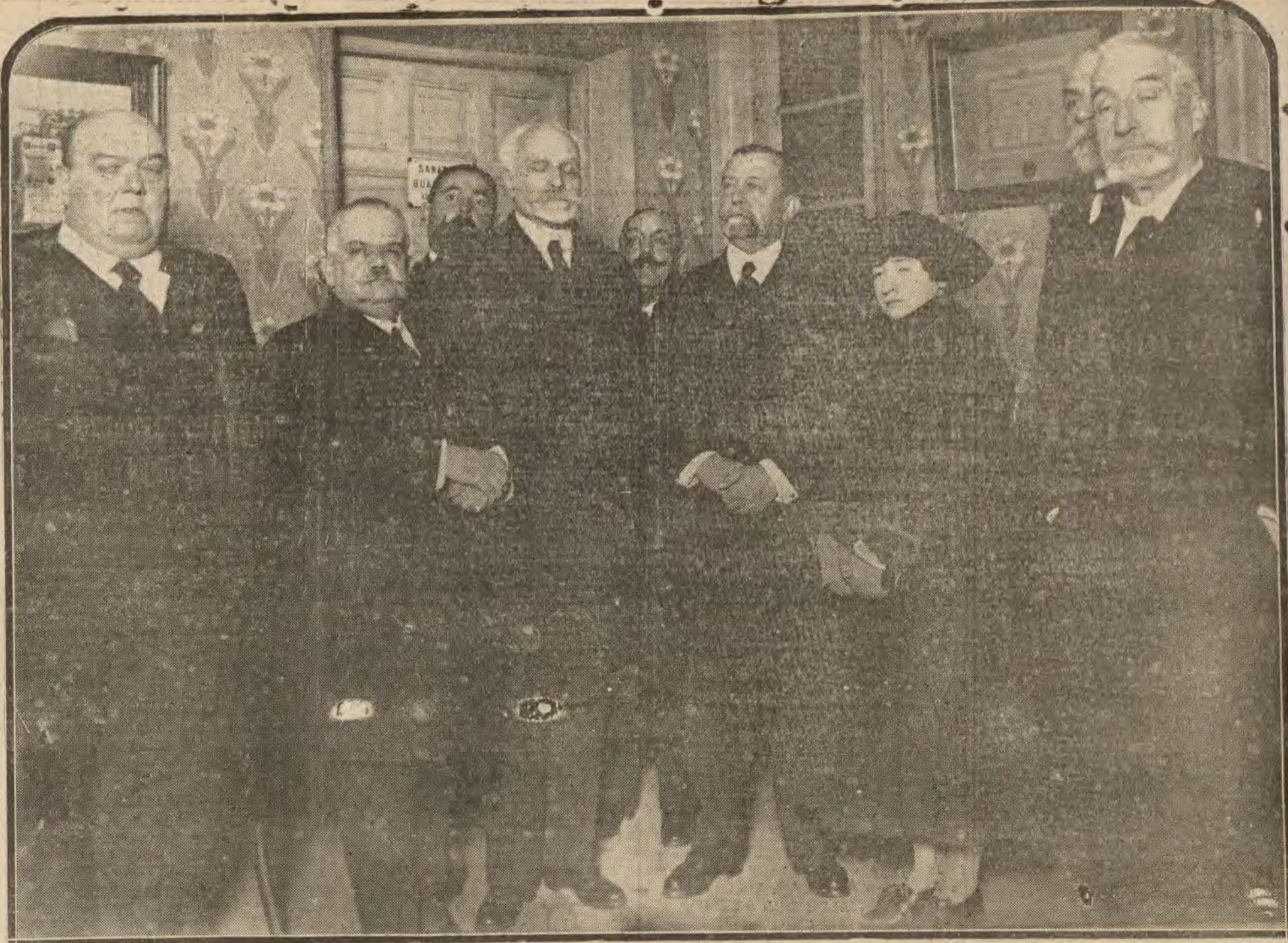
MADRID.—El ministro de la Gobernación en la sesión inaugural de la Sociedad de Higiene.