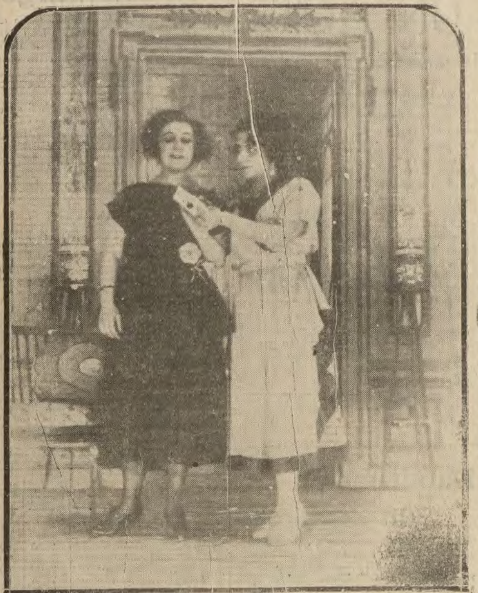
MADRID.—Una escena de la «La Reina de la ópera», que se estrena hoy en el teatro de Lara.