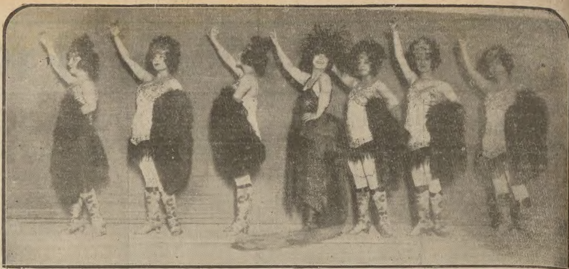
MADRID.—Una escena del «Príncipe Carnaval», que se estrenará mañana en el teatro Reina Victoria.

30 por 100 ha relajado en sus artículos la importante Casa LA EXPOSICION. Camisería, PRINCEPE 19 y 21, en corbatas, calcetines y bufandas de lana y seda. Ventas por mayor y menor.