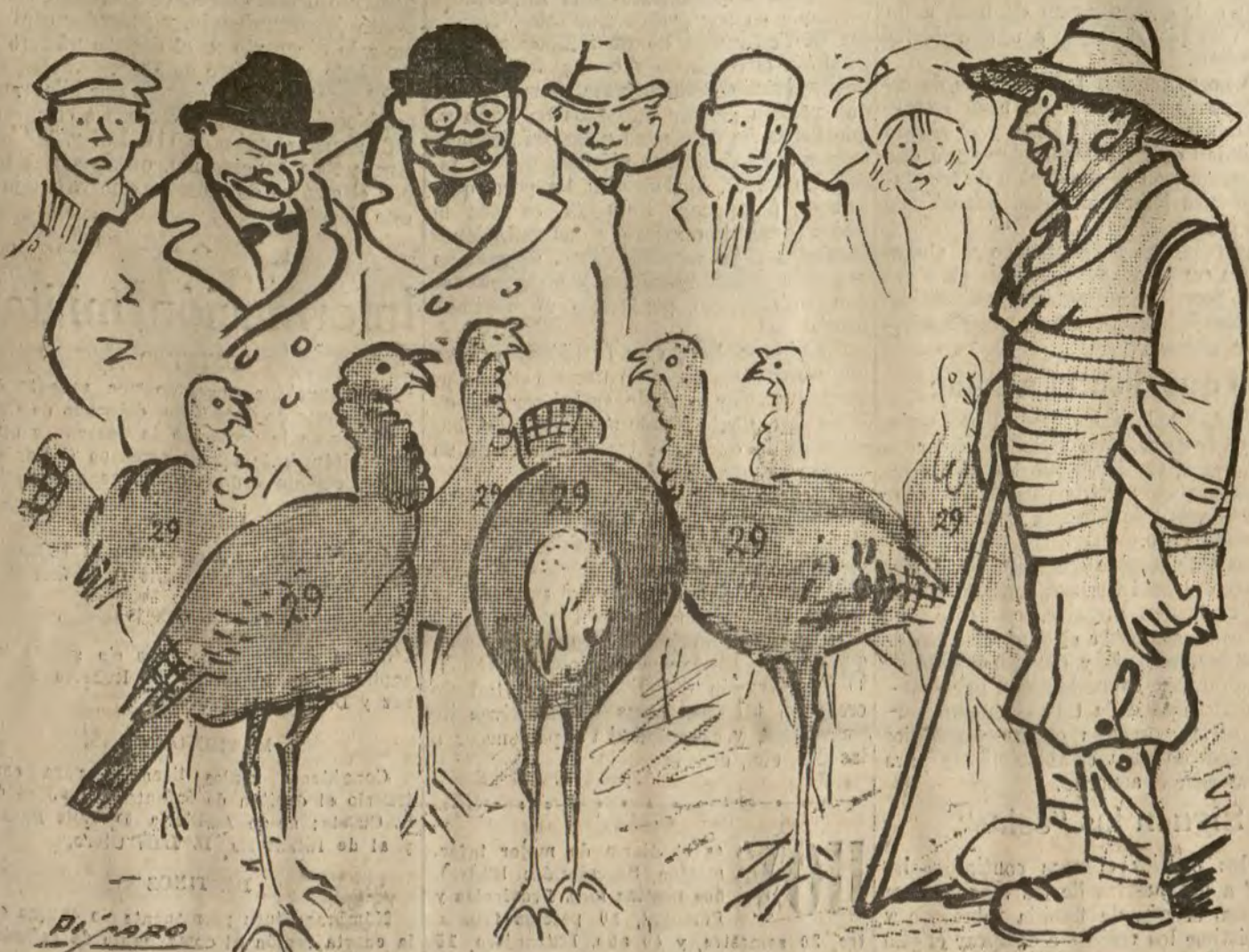
— Los más gordos y los más baratos!