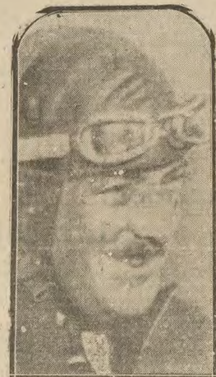
PARIS.—Sadi Leconte que ha batido el «record» de velocidad en el aeródromo de Villacoublay, corriendo cuatro kilómetros en cuarenta y seis segundos.

Equipos militares, con paños de Béjar, a precios económicos, en la sastrería VICTOR MANUEL.—CARMEN, 30, pral.