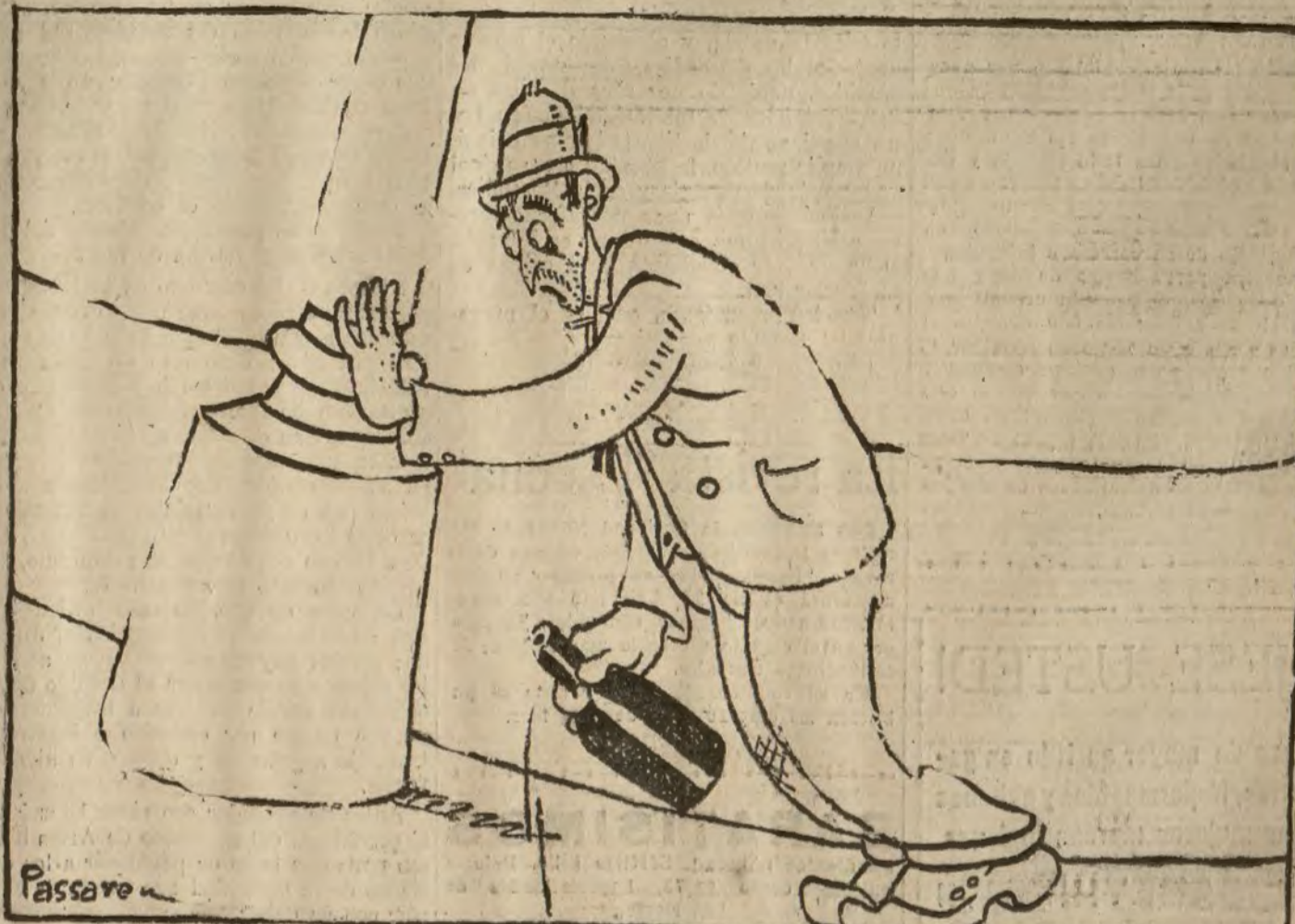
— Todo rueda. Tienen razón los que aseguran que el mundo está desquiciado.