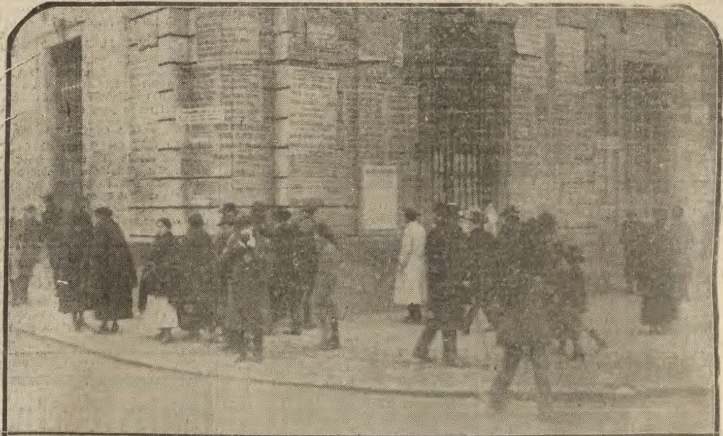
MADRID.—Aspecto de la fachada del Ministerio de la Gobernación, cubierto de candidaturas

Venimos para todos los puntos de España Solicítense catálogos, que enviaremos gratis, dirigiéndose a ODEON, Preciados, 1. MADRID