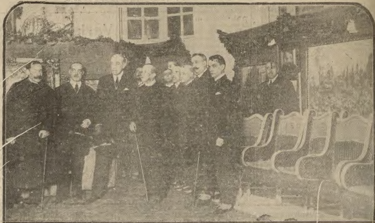
MADRID.—Inauguración de la Exposición Fortuny, con asistencia del ministro de Instrucción Pública