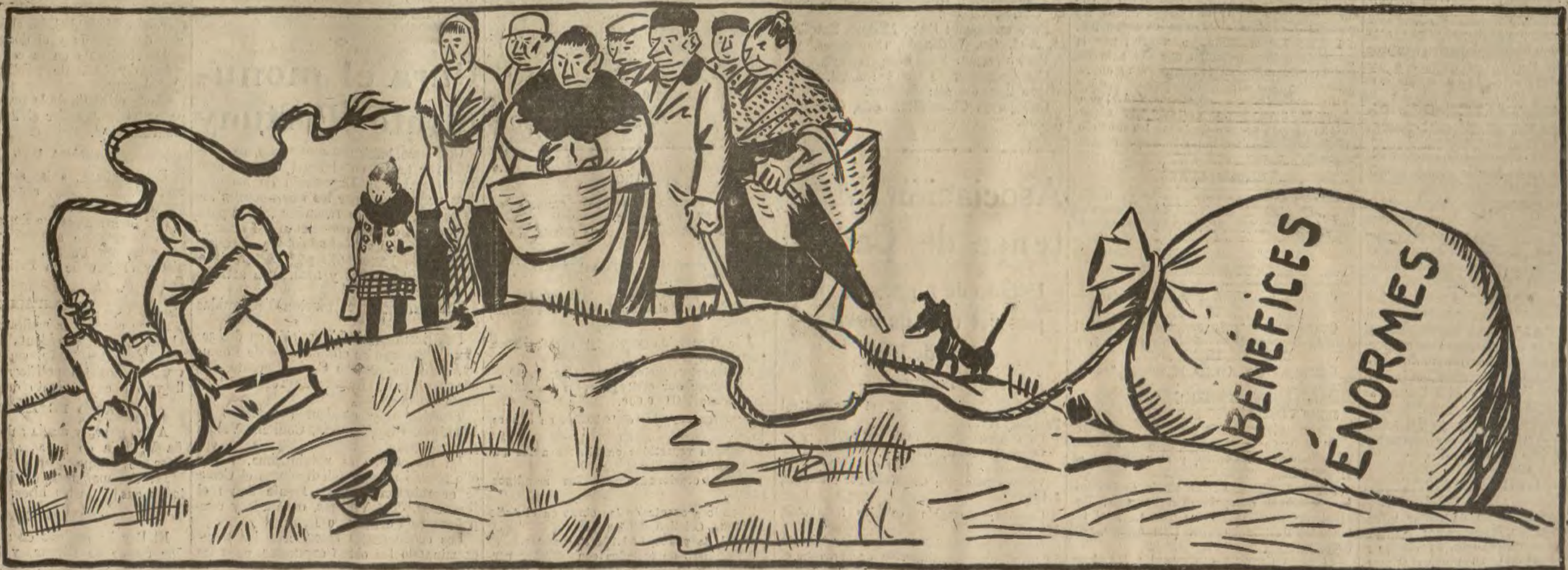
—¡Tiró de nasiado y rompió la cuerda! (N. de la R.—Reproducimos este oportuno dibujo de "La Journal" deplorando que sólo se refiera a Francia. ¿Cuándo podrán hacer nuestros dibujantes un dibujo parecido?)