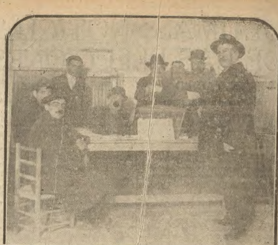
MADRID.—Alejandro Lerroux, [vota]