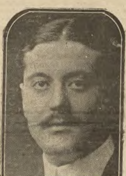
Conde de Santa Engracia