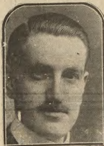
Conde de Vallellano