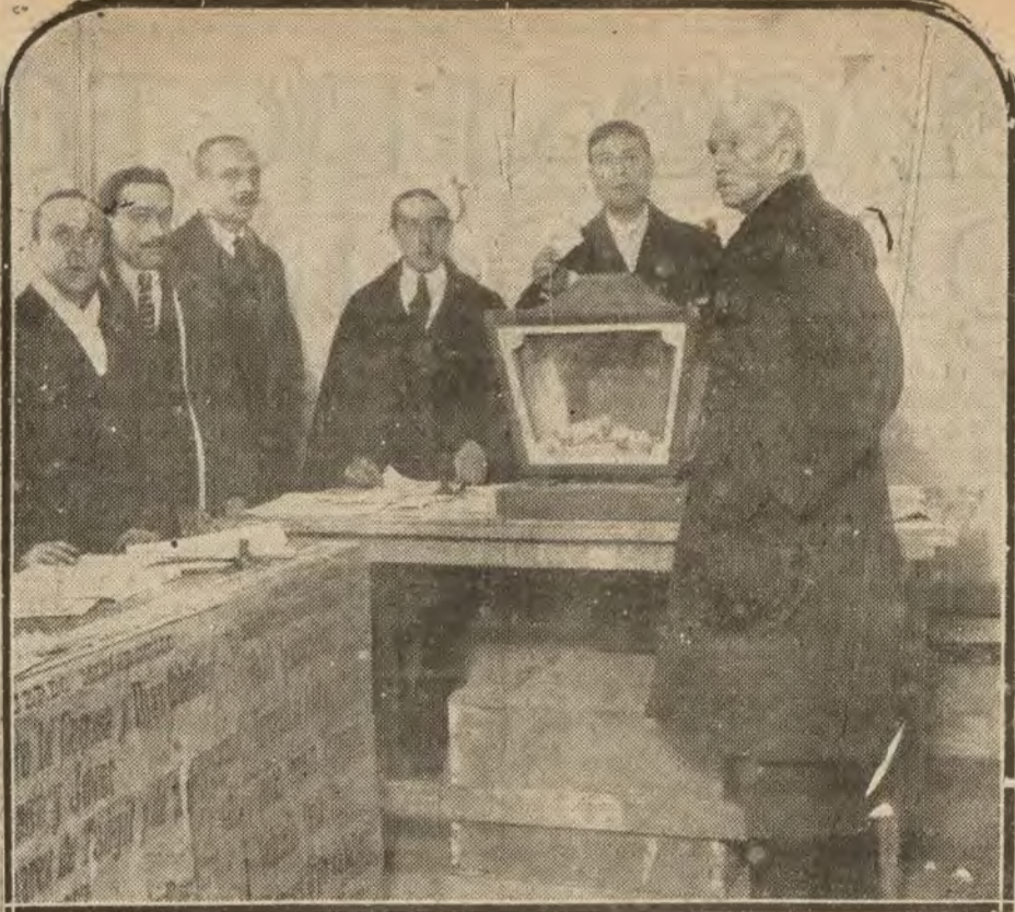
MADRID.—Eduardo Dato e Iradier, [vota]