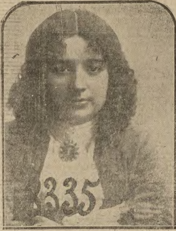
Reina Victoria 8.335