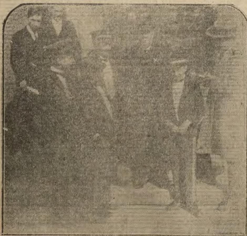
TERCER PREMIO.—El administrador (x) y chicos que han sacado la bola de dicho premio

Joyería Moderna ULTIMAS NOVEDADES PARA REGALO Montera, 21