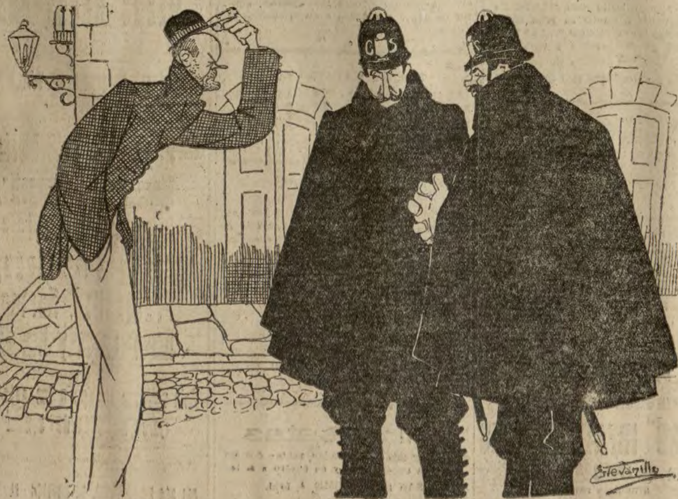
LAS VÍCTIMAS DEL HAMBRE

—¿Me harían ustedes el favor, "feliz pareja", de acompañarme a la Casa de Socorro? Porque la verdad es que la vida está cada día mas cara y llevo quince días sin comer, hoy me he decidido a ingerir los tirantes" y... ¡siento una tirantez!..