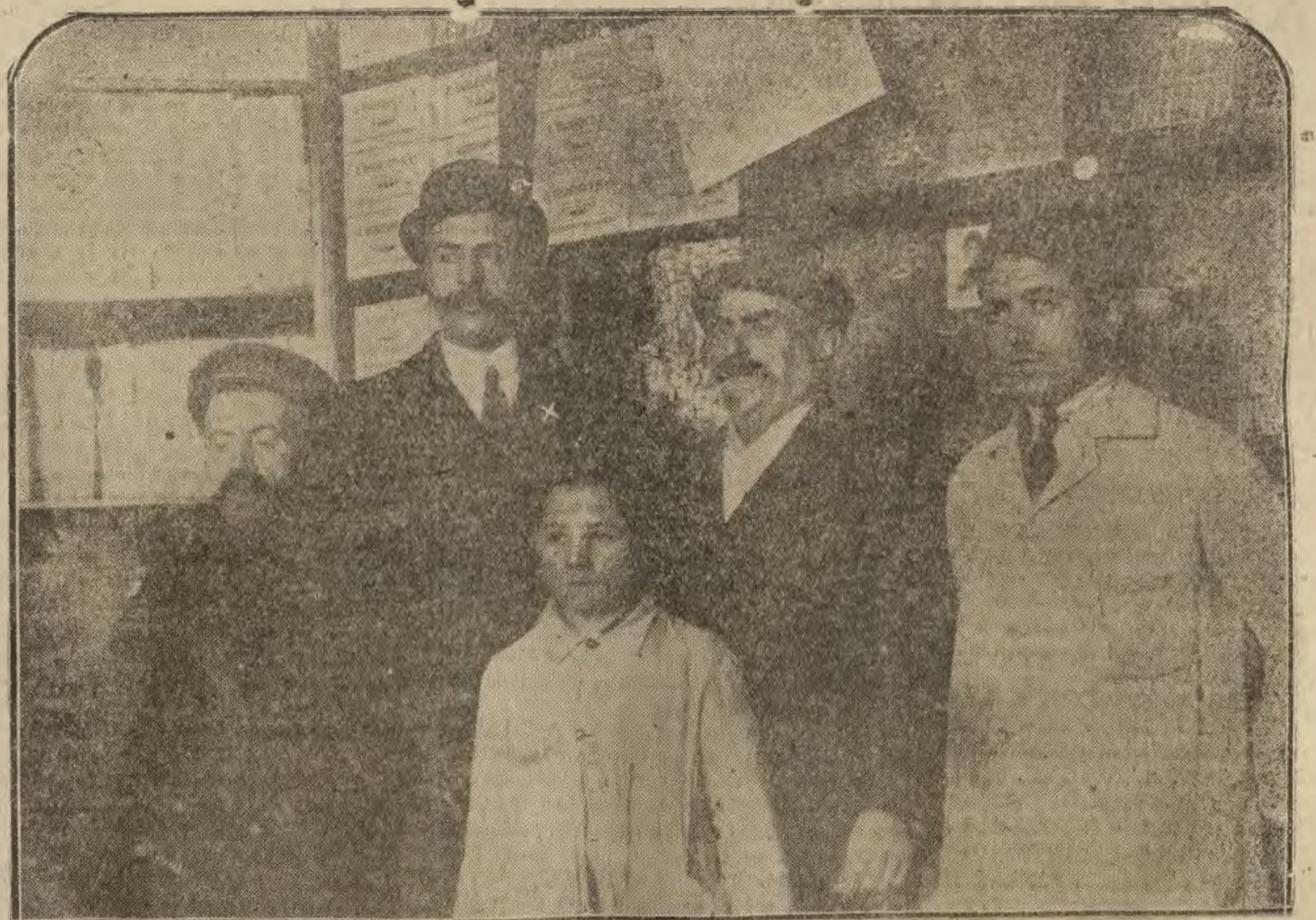
SEGUNDO PREMIO.—En la administración de la plaza del Angel. El administrador (x) y encargados de la venta y hombre que ha vendido participaciones de la centena