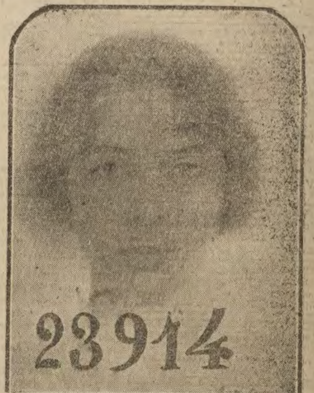
Esclava 23.914