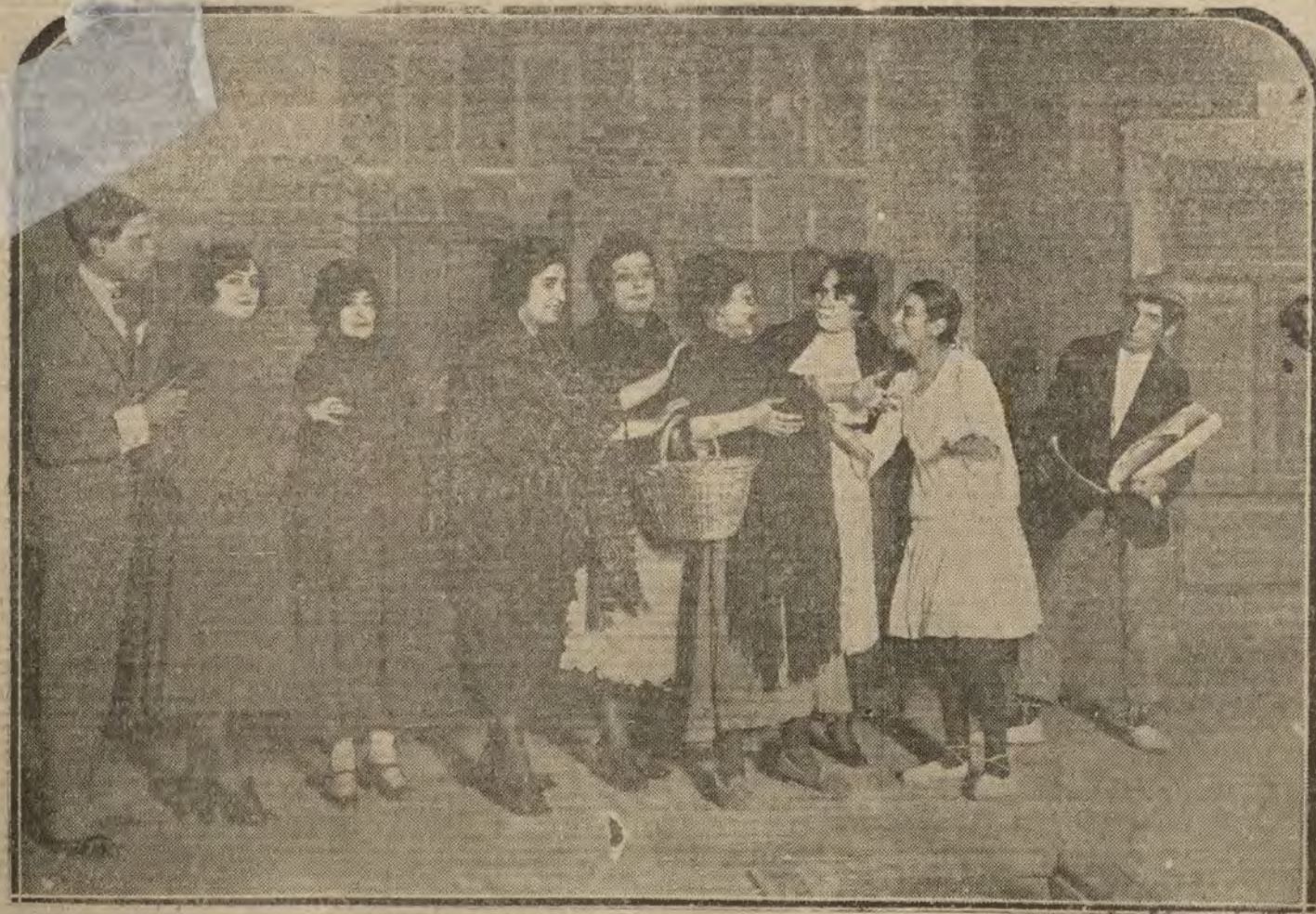
MADRID.—Una escena de «Modistillas y perdigones», estrenada anoche con éxito en el teatro Cómico

VIVER, PARA CREER!! Si quiere V. ganar dinero, no venda ninguna de sus alhajas o papeletas del Monte: de alhajas, ropas y toda clase de efectos aunque estén empeñadas en Casas de Préstamos, SIN VER LO QUE PAGA EL CENTRO DE COMPRA TELEF. M. 35-73.—ESPOZ Y MINA, 3 (CENTROSUELO).—Tasador autorizado. Brillantes y perlas de primera, compraríamos, pagando todo su valor.