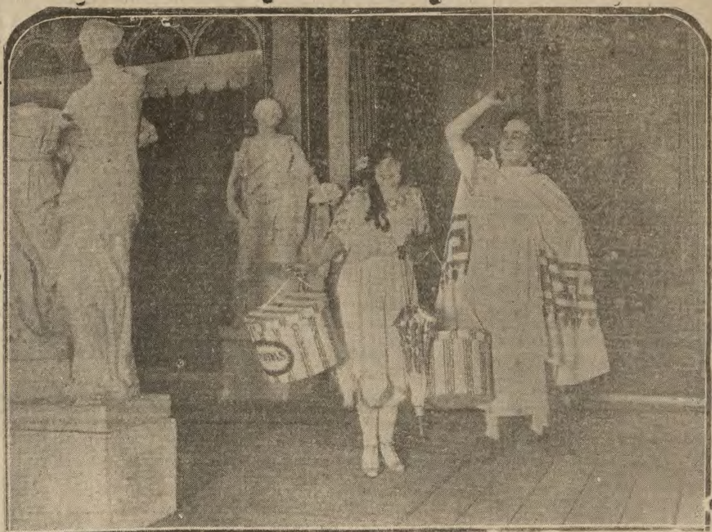
MADRID.—Una escena de «El Fin», obra estrenada ayer con éxito en el teatro de la Zarzuela