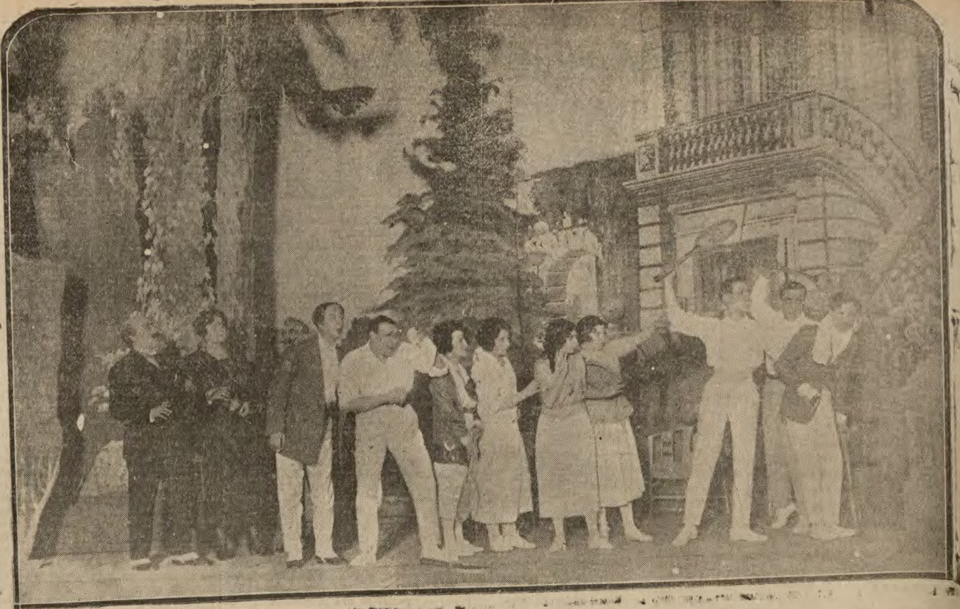
MADRID.—Una escena de la esplandisima comedia de Arniches y Abatí «No te ofendas, Beatriz», estrenada ayer en el teatro Eslava

Joyería Moderna ULTIMAS NOVEDADES PARA REGALO Montera, 21