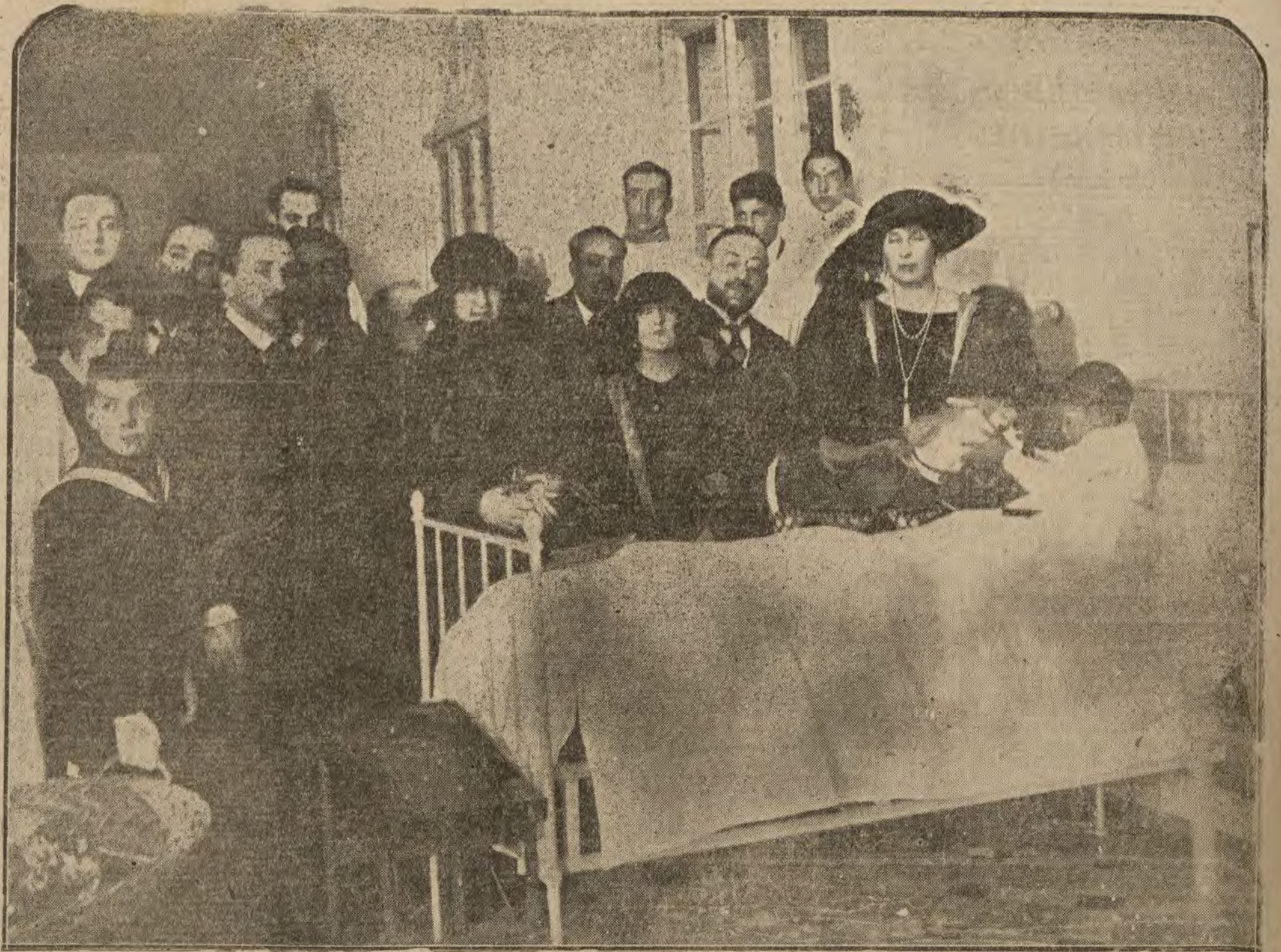
MADRID.—S. M. la Reina Victoria, repartiendo juguetes a los niños enfermos, en el Hospital del Niño Jesús.