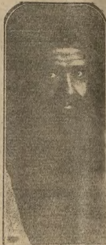
MADRID.—Max Krause, Baritono del teatro Real.

HOY es el diario de mejor información. Suscripciones: Madrid, 10 pesetas más Provincias y Portugal, 10 pesetas trimestre. 26 semestre y 40 año. Extranjero 15 pesetas trimestre, 30 semestre y 40 año.