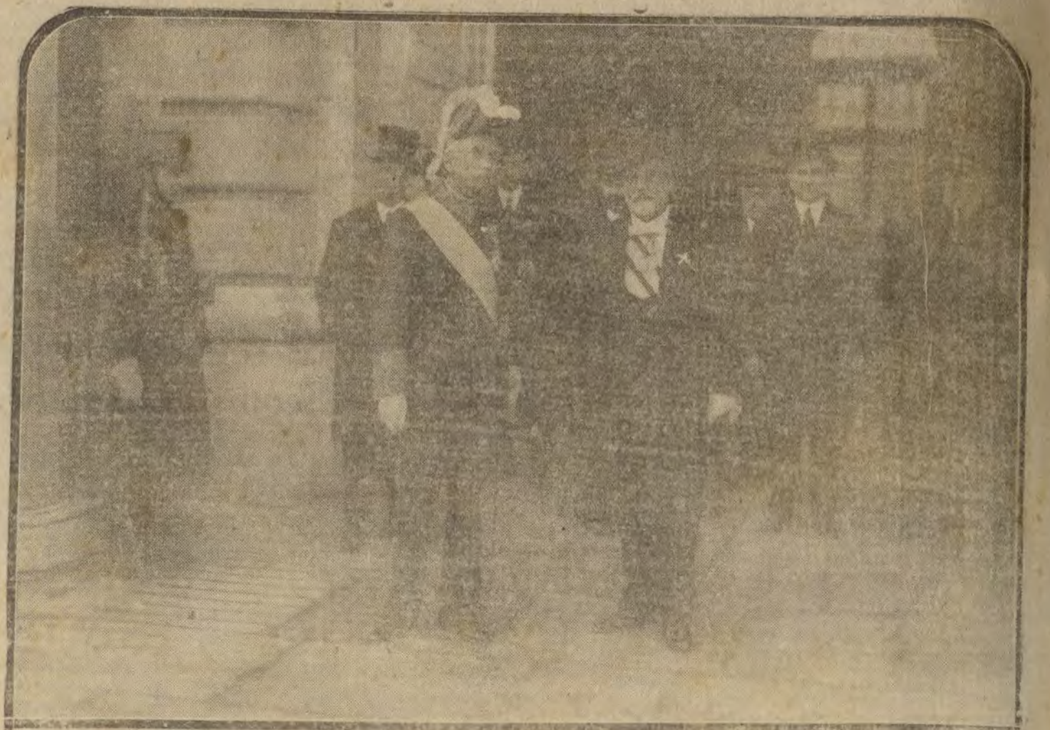
MADRID.—El nuevo ministro de Instrucción, D. Montojo (x), al salir ayer de Palacio, después de haber jurado el cargo ante S. M. y asistido al Consejo de ministros.

En la Sección de señoras han puesto precios muy económicos y una confección esmeradísima en trajes de levita, gabanes y gabardinas a medida. Además, en la Sección de caballeros, se siguen haciendo trajes moda americana. Lo más elegante. Equipos para soldados de cuota.