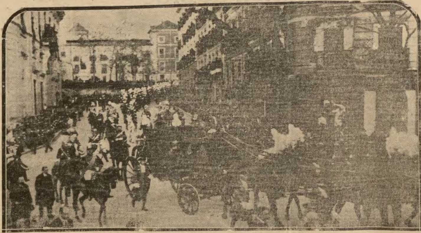
MADRID.—Sus Majestades y la regia comitiva regresando del Palacio del Senado, después de la ceremonia de la apertura de las Cortes.

Inmediatamente se veía el "landau" llamado de bronce, tirado por cuatro soberbios caballos, ostentando guarniciones