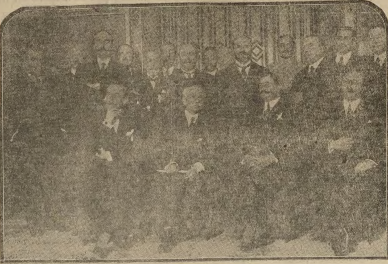
MADRID.—Ministerio de Estado.—Banquete en honor del general Berenguer