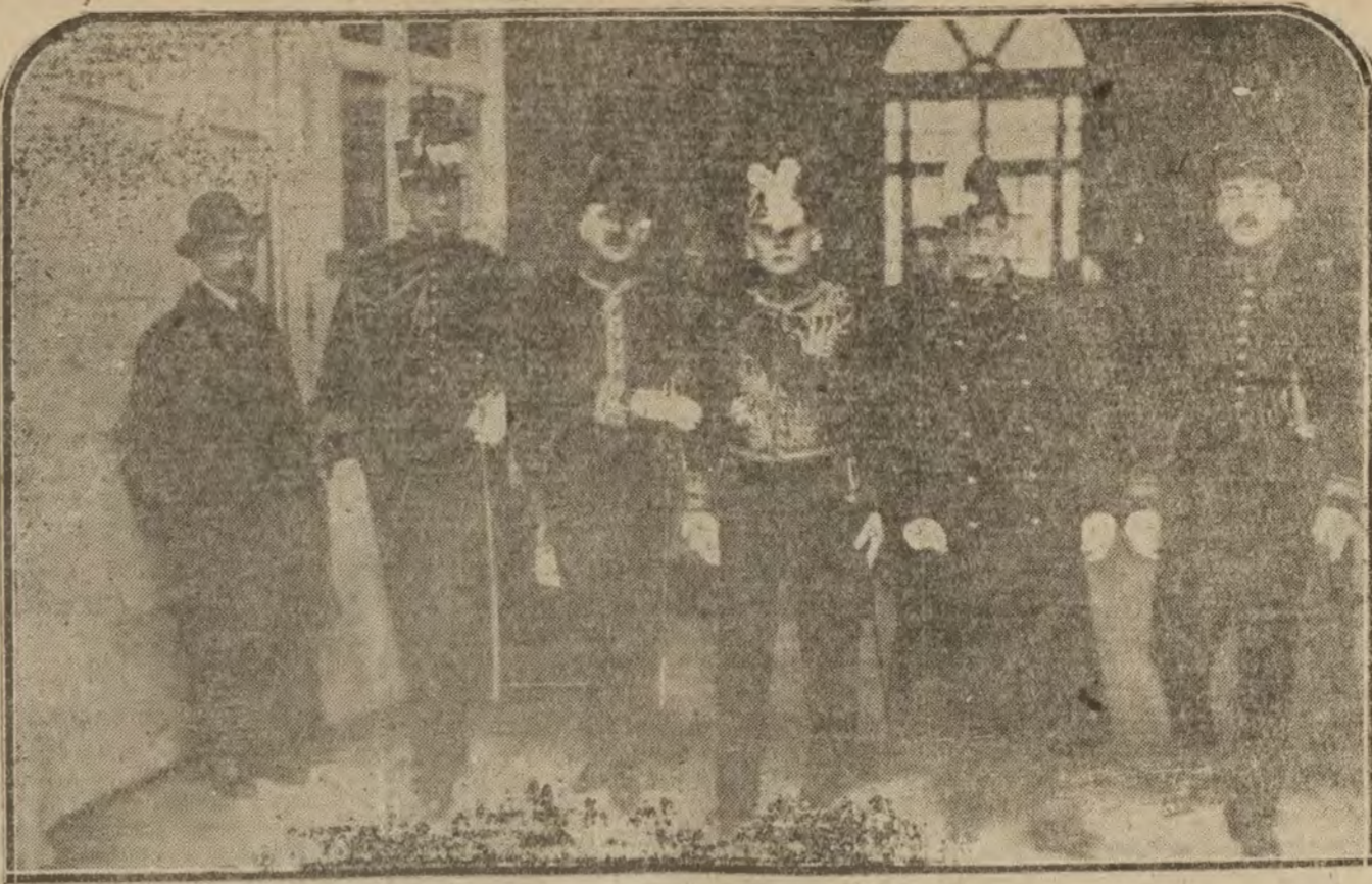
MADRID.—El nuevo ministro del Perú en España, al salir ayer mañana de Palacio de presentar al Rey sus cartas credenciales