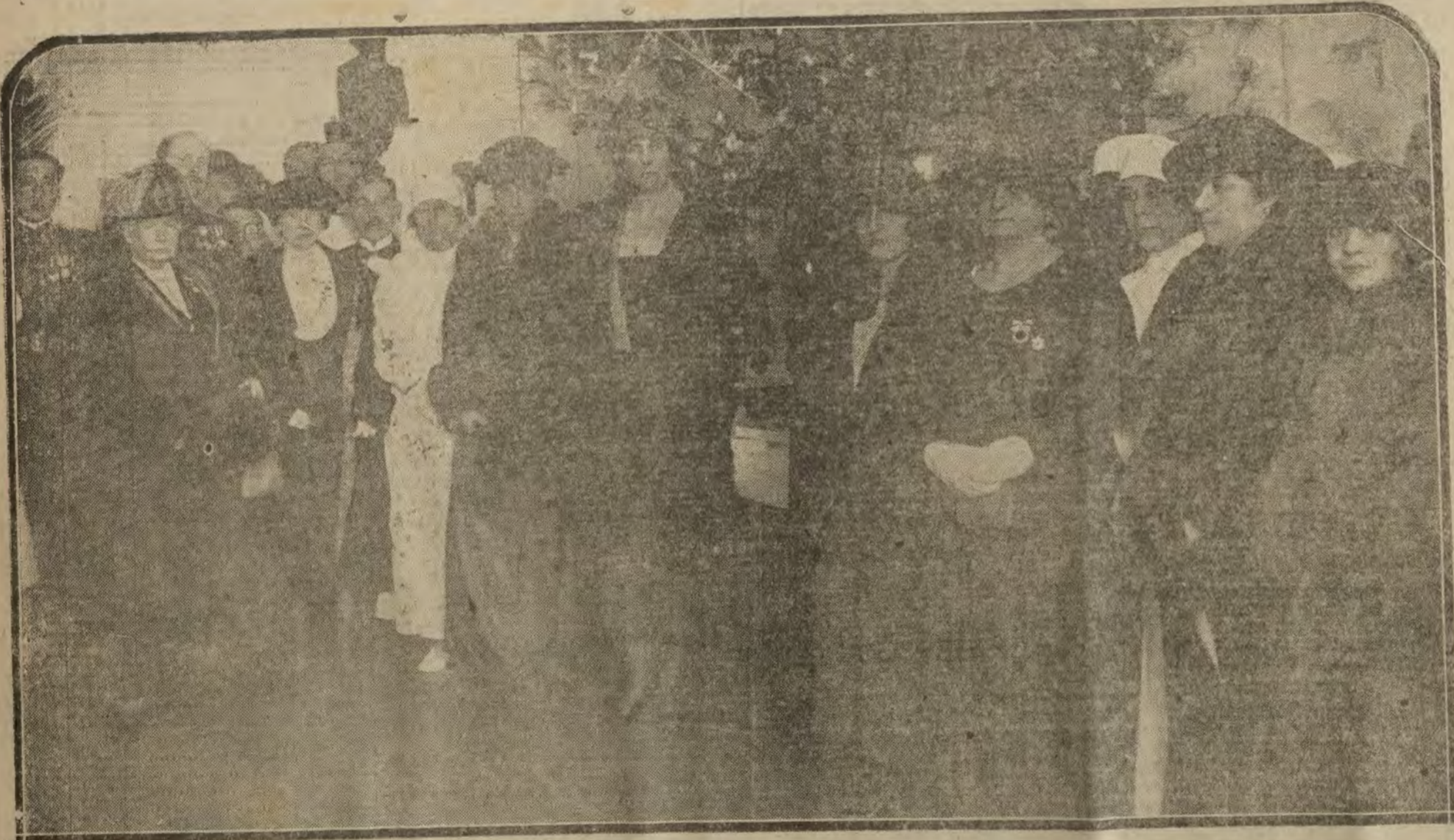
MADRID.—SS. MM. las Reinas doña Victoria y doña María Cristina, en la fiesta del Arbol de Madrid, celebrada ayer en el Hospital de San José y Santa Adela

Joyería Moderna ULTIMAS NOVEDADES PARA REGALO Montera, 21