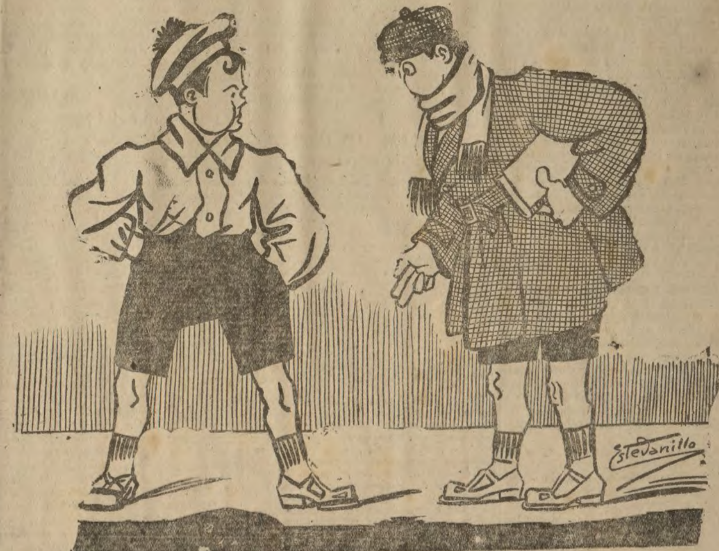
EL MEJOR REGALO

—¿Esta marca "Star" dice usted que es buena? —Figúrese, todos los atentados de Barcelona se cometieron con ella.