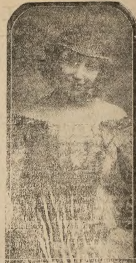
MADRID.—Carmen Seco, primera actriz del teatro Español, que ha celebrado con gran éxito su beneficio