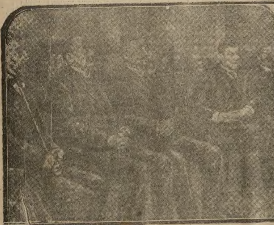
CHARTRES.—M. Deschanel reanuda su vida política.—El ex presidente en el Congreso de delegados de Euret-Solr, M. Deschanel, al salir del Congreso