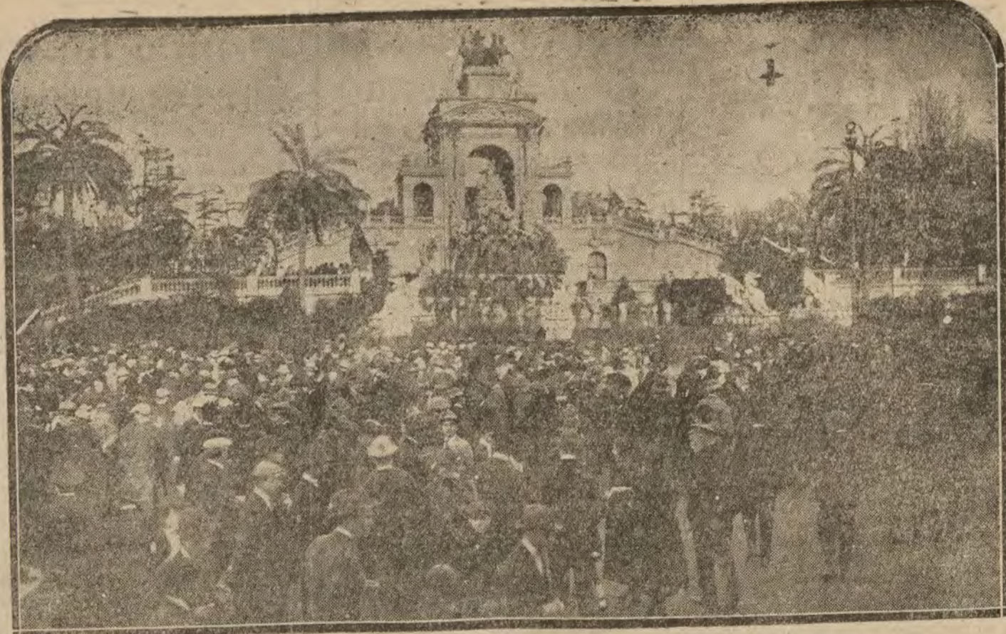
BARCELONA.—Aspecto del Parque en la celebración del «Día de la Lengua Catalana»