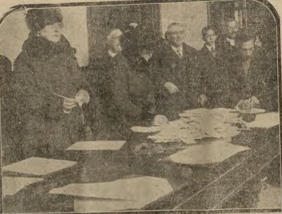
BARCELONA.—Homenaje a Martínez Ando. El público firmando en los álbumes