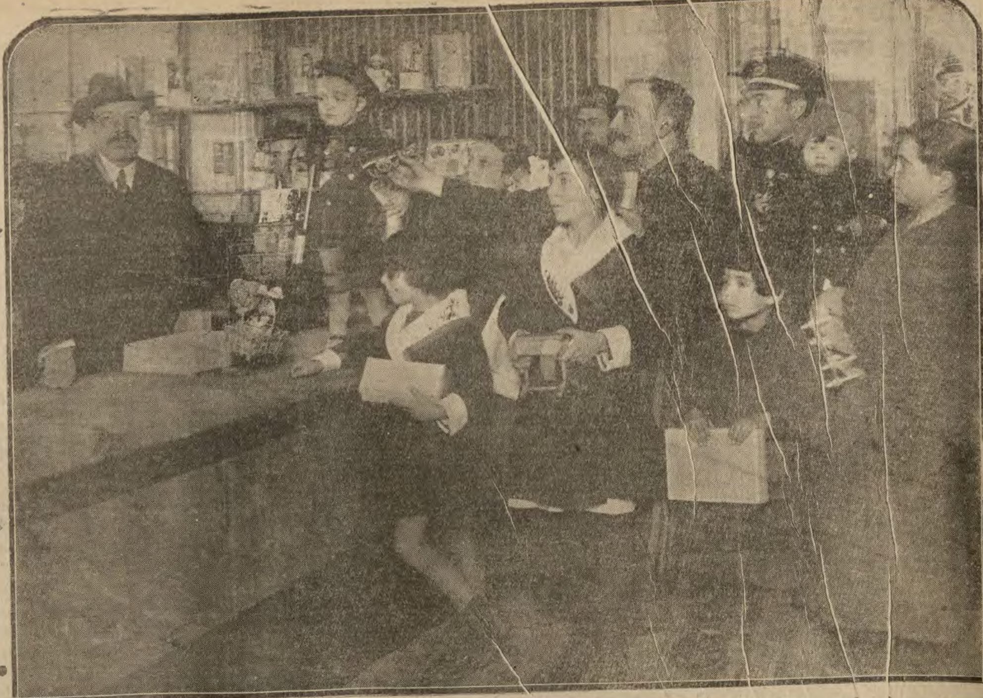
MADRID.—Reparto de juguetes a los niños en el teatro del Centro, regalarlos por el Centro de Hijos de Madrid.

Joyería Moderna ULTIMAS NOVEDADES PARA REGALO Montera, 21