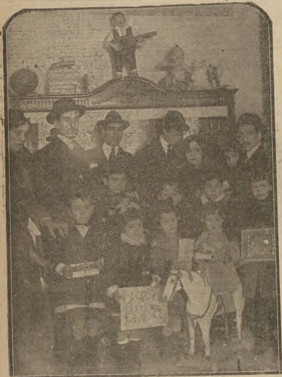
MADRID.—Reparto de juguetes de la juventud maurista en el teatro Roma.