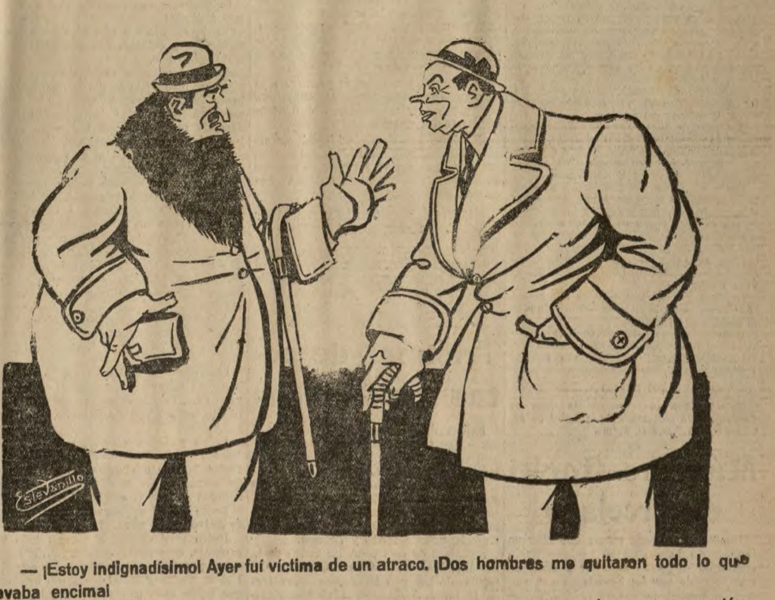
LA SITUACION DE ALGUNOS BANCOS