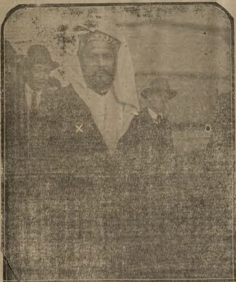
MADRID.—El cabildo de Aroa al salir de Palacio ayer tarde.

Compro finca rústica de utilidad y recreo cerca de esta. SERRANO, 37, pral. Un cuarto a uno y de otros a otro.