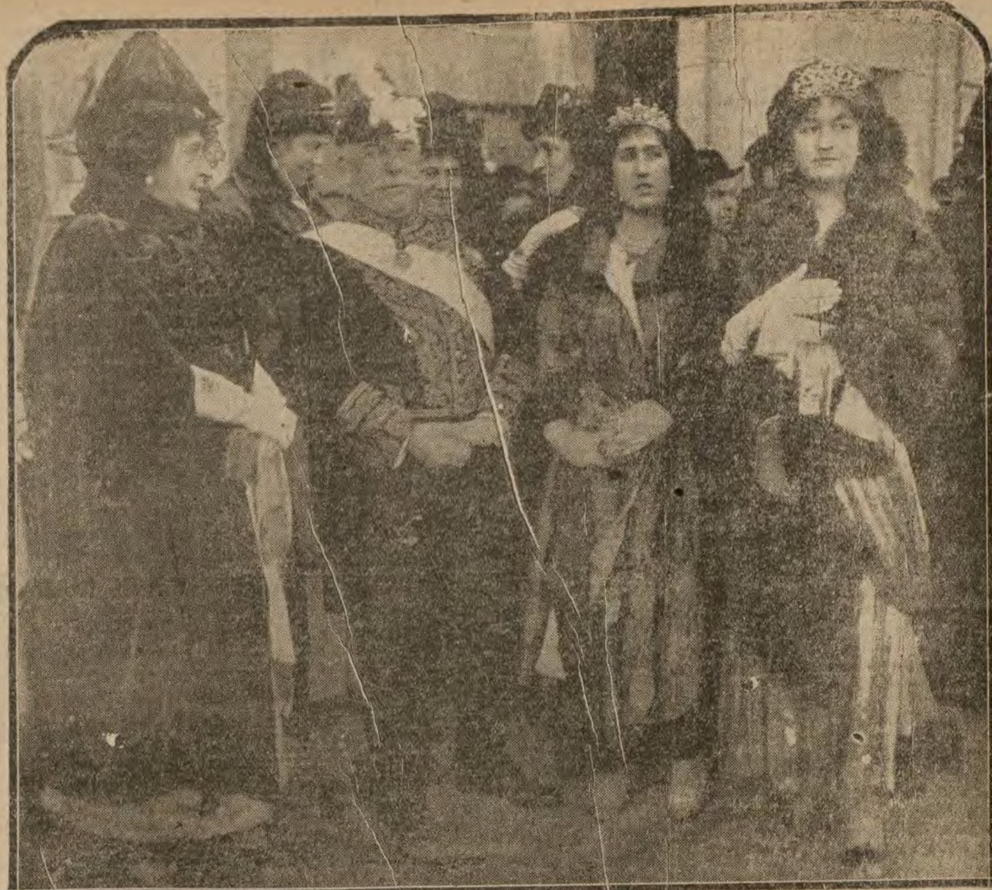
MADRID.—Damas de la Reina y Grandes de España, saliendo de la capilla pública celebrada ayer en Palacio.