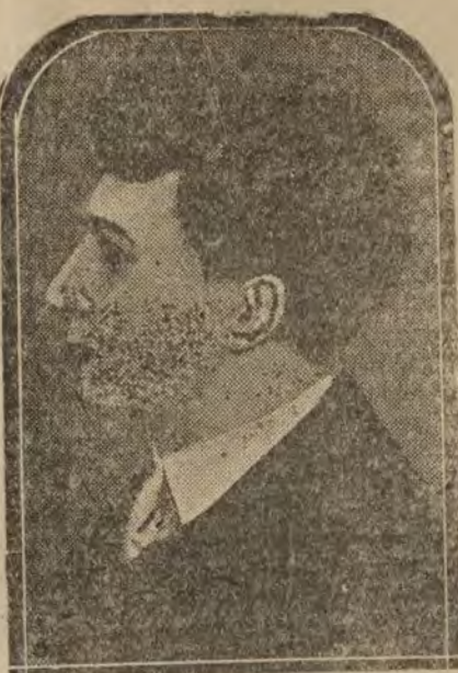
El hijo de D'Annunzio, que ha sido detenido en Fiume.