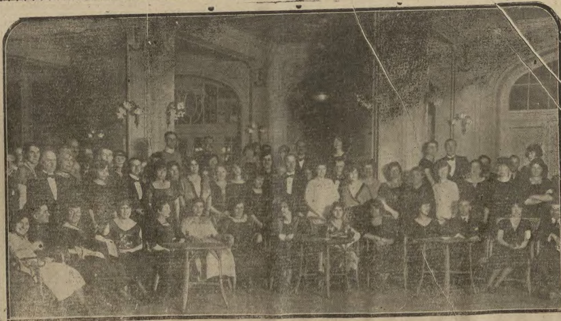
MADRID.—Baile que celebró anoche en el Palace Hotel la colonia inglesa.

de primera necesidad. A las personas industriales y a las familias en general: Con un capital de 150 a 200 pesetas, manejadas por el mismo y sólo tres días de trabajo cada semana se consiguen de 6 a 7 pesetas diarias. Se mandan explicaciones detalladas e impresos a todo el que pida, mandando sellos 20 céntimos. Contestar: D. Parilio Landaburu (Alava) Vitoria.