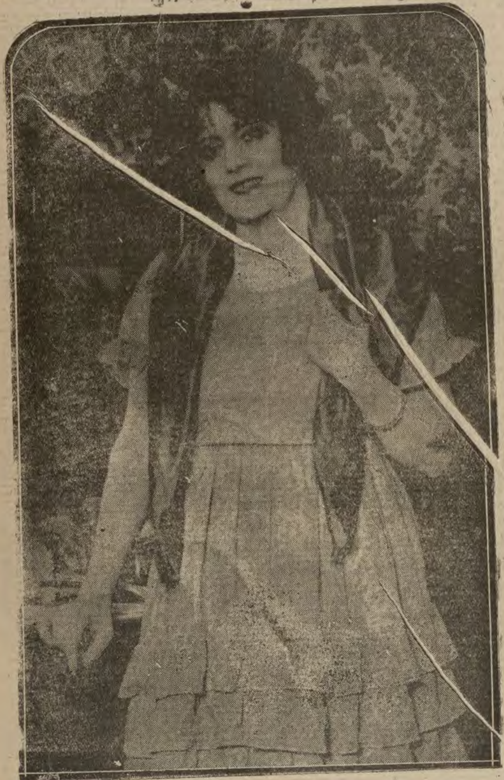
MADRID.—Camila Quiroga, distinguida primera actriz de la compañía argentina que actúa en el teatro de la Princesa.