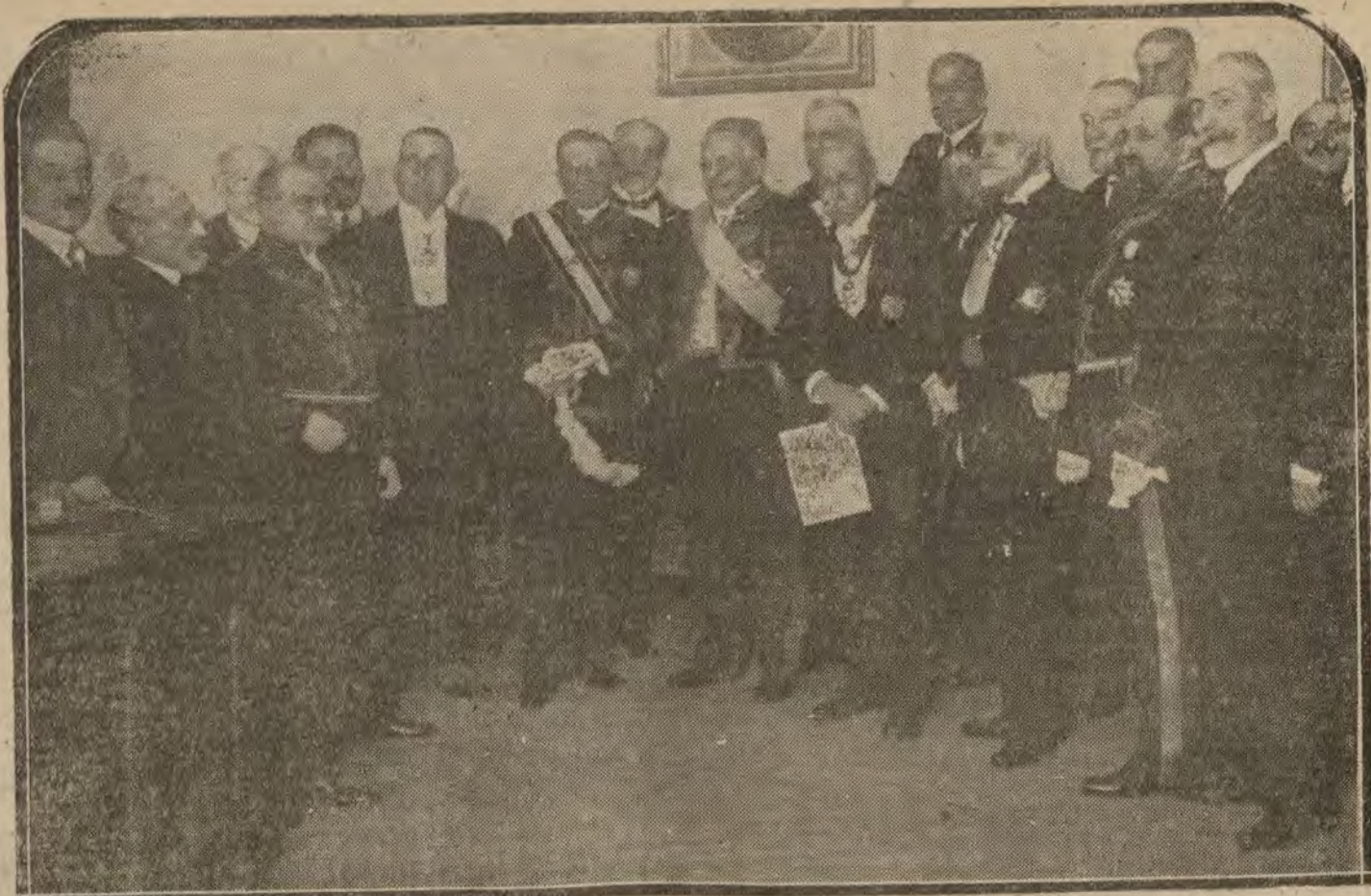
MADRID.—Inauguración del curso en la Academia de Medicina.