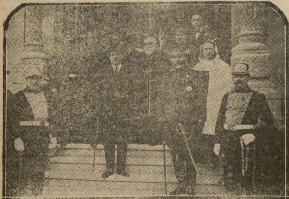
BARCELONA.—El gobernador civil y demás autoridades saliendo de la iglesia del Carmen, después de su inauguración y consagración