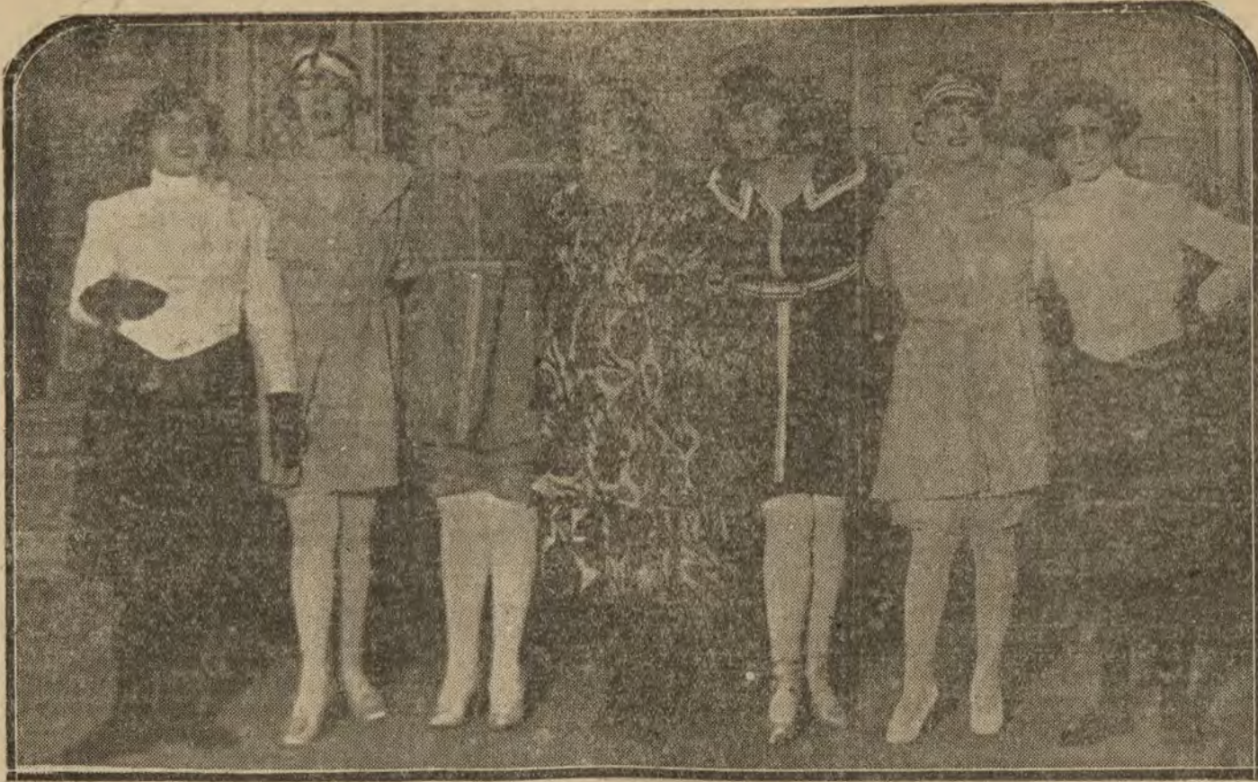
MADRID.—Una escena de «La pena de los cien», que se representa con éxito en el teatro Comico.

Vendemos para todos los puntos de España Solicítense catálogos, que enviaremos gratis, dirigiéndose a ODEON, Preciados, 1. MADRID