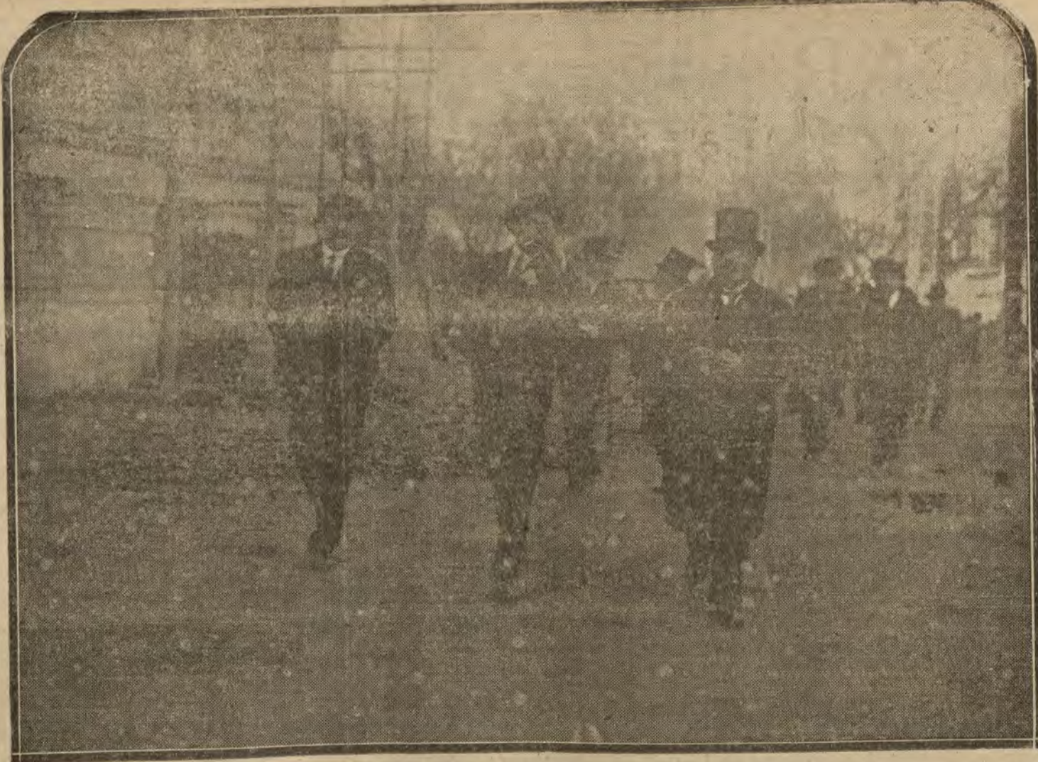
SEVILLA.—El Rey, acompañado del alcalde y del arquitecto señor Esplan, visitando las obras del Gran Hotel Alfonso XIII