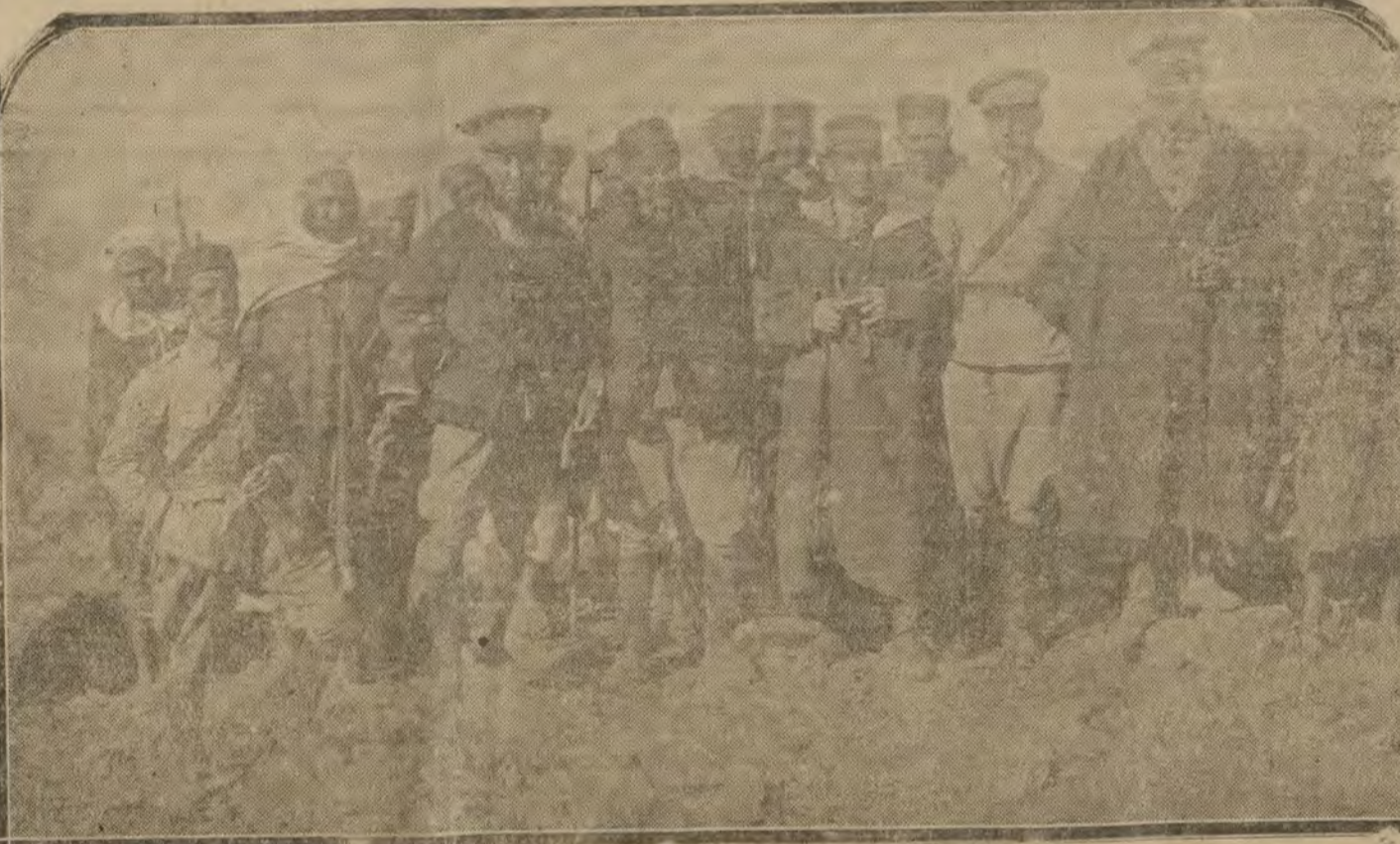
MELILLA.—El capitán y oficiales de la undécima «mis» de Policía indígena que ocuparon Arru