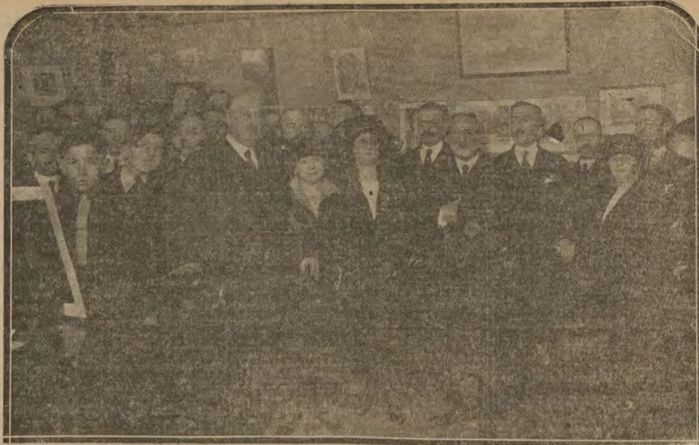
MADRID.—El ministro de Instrucción pública (x), en la Exposición de Asuntos regionales de Cuenca, inaugurada ayer tarde en el Ateneo.