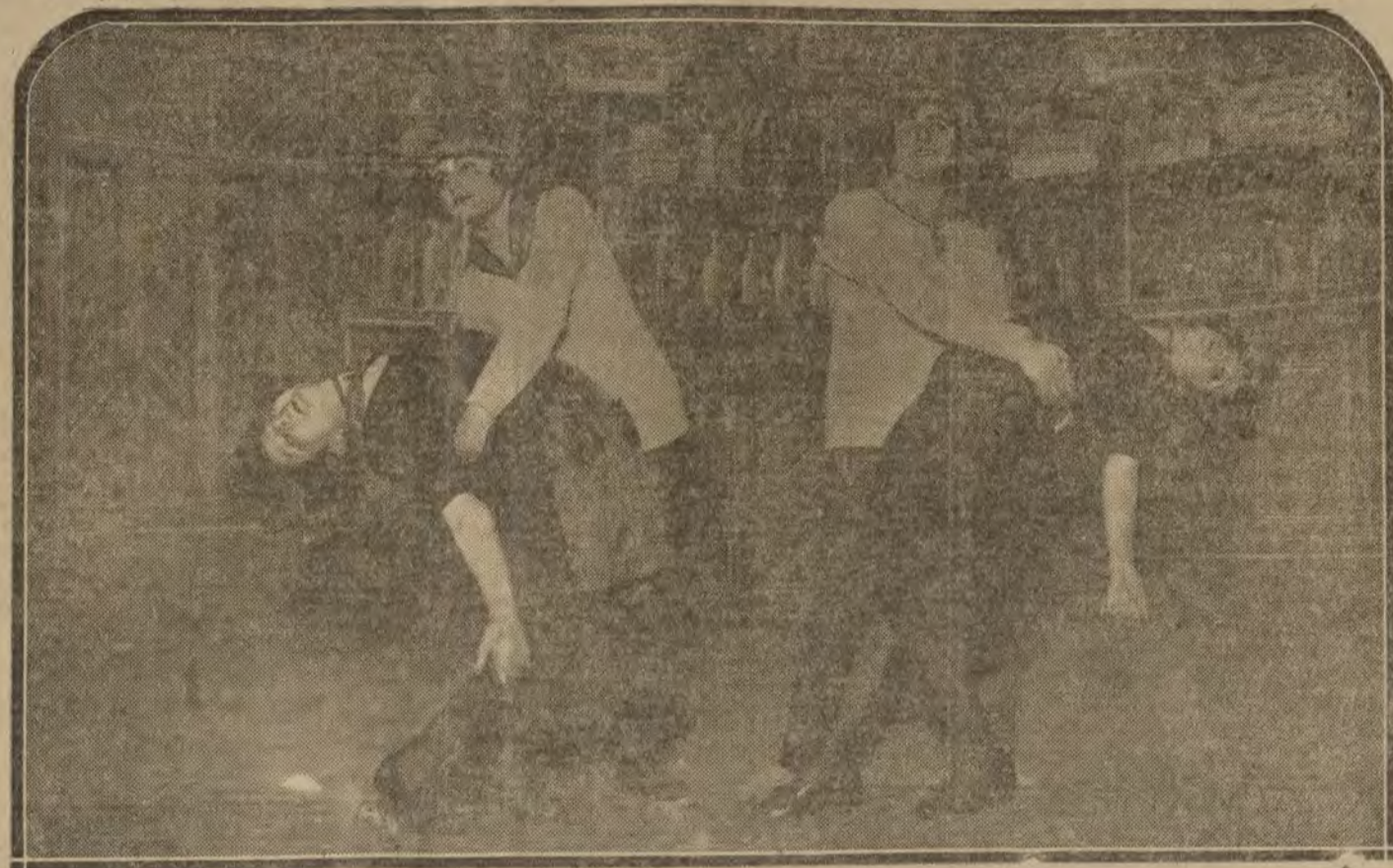
MADRID.—Una escena de la obra «Los Reyes de la pantalla», estrenada anoche en el teatro Comico.