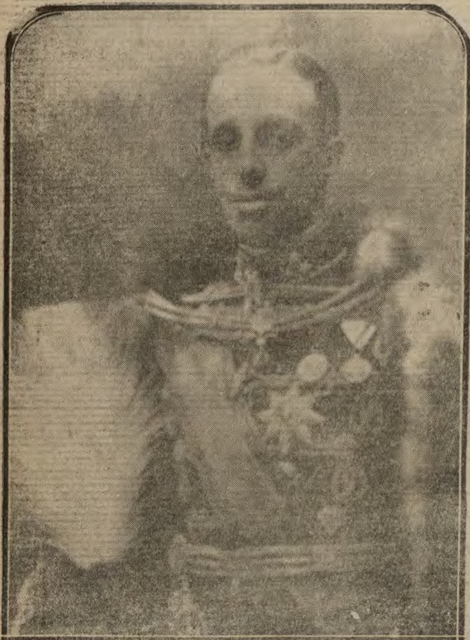
MADRID.—S. M. el Rey Don Alfonso XIII, que mañana celebra su fiesta onomástica, con motivo de lo cual se pone de manifiesto, como todos los años, el amor de sus súbditos.