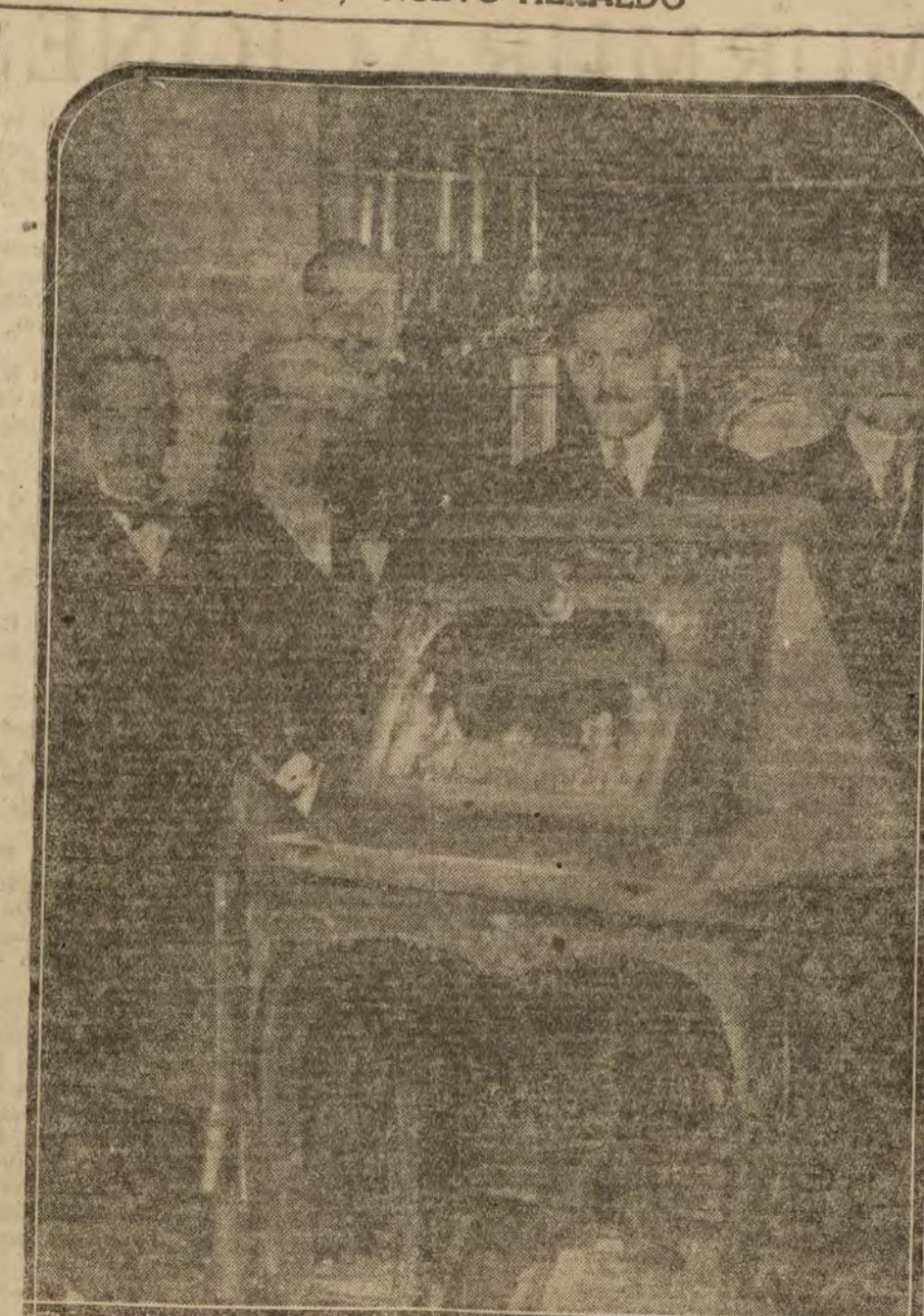
MADRID.—El Rey con el presidente del Consejo y la Comisión de la Quinta de salud «La Alianza», de Barcelona, que le ha entregado una artística placa conmemorativa de la colocación por S. M. de la primera piedra del pabellón de infecciosos en el Hospital de dicha Sociedad.

El público, confirmó el juicio que la ha merecido la comedia cuando se representó en Belva.