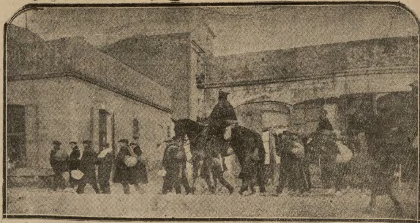
BARCELONA.—Salida de la cárcel de varios presos gubernativos que por conducción ordinaria son llevados a sus respectivas provincias.

30 por 100 ha rebajado en sus artículos la importante casa LA EXPOSICION, Camisería, PRINCEPE 19 y 21, en corbatas, calcetines y bufandas de lana y de seda. Ventas por mayor y menor. Fábrica de corbatas.