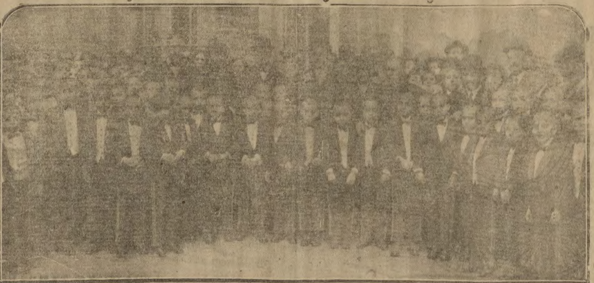
MADRID.—El alcalde de Madrid con los señores de su Ayuntamiento, acompañados del Sr. Dato al salir de Palacio para solemnizar el día de su santo patrono.

Derecha de S. M. la Reina: archiduque Alberto, Infanta doña Luisa, Príncipe don Gabriel, señora de Ordóñez, ministro de Estado, dama de guardia de S. M. la Reina, marquesa de Quirós, ministro de la Guerra, dama de guardia con la Infanta doña Isabel, duquesa de Alfiga, ministro de Instrucción pública, dama particular