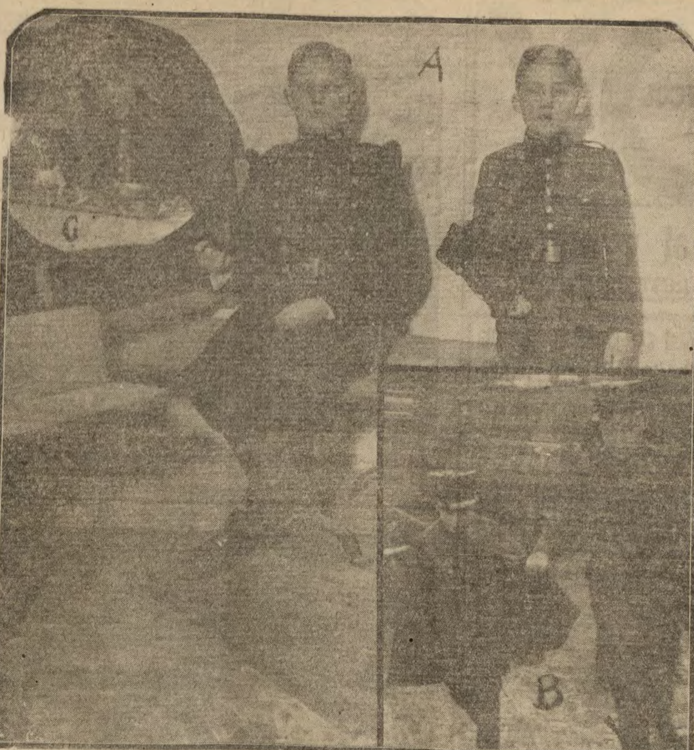
MADRID.—S. A. R. el Príncipe de Asturias, con su hermano el infantito D. Gonzalo, en su visita al cuartel donde se aloja el Regimiento del Rey.—a) El Príncipe de Asturias sentado en su cama del cuartel, con el infantito D. Gonzalo. b) Recorriendo el cuartel. c) S. A. el infantito D. Gonzalo probando el rancho.