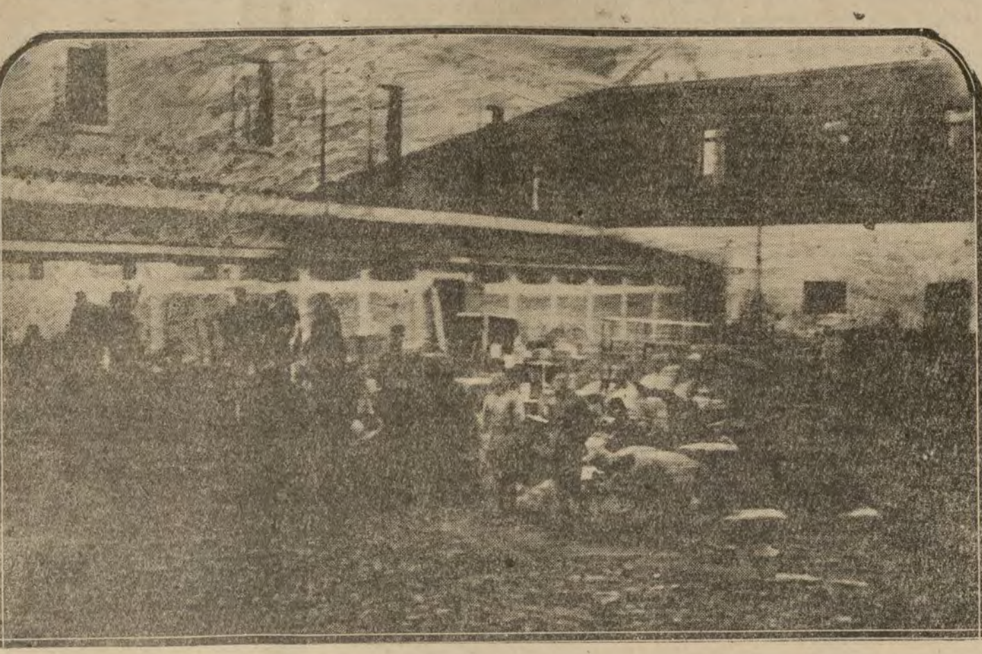
MADRID.—Patio del cuartel de Artillería incendiado ayer en Vicálvaro, donde se depositaron, algunos de los enseres que pudieron salvarse del pabellón destruido.