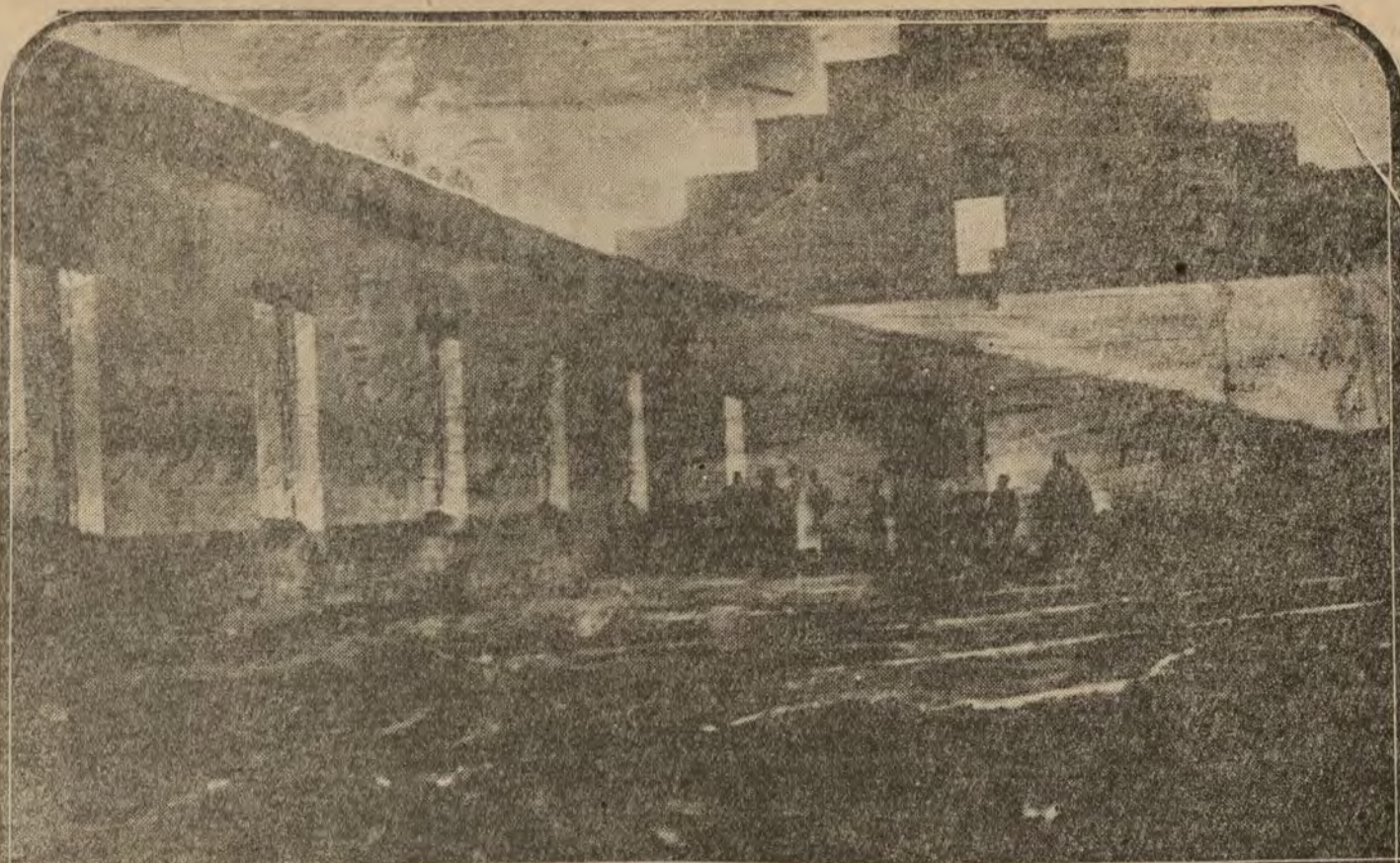
MADRID.—El pabellón del cuartel de Artillería de Vicálvaro donde se inició el incendio ayer tarde y que quedó por completo destruido.