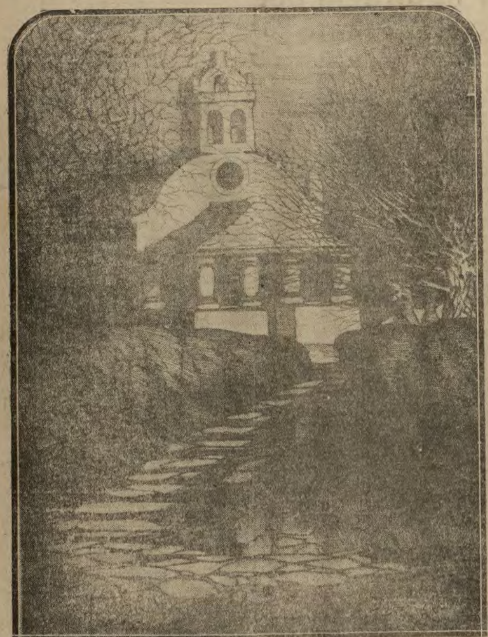
MADRID.—A la iglesia de Mazoucas, aguafuerte de Castro-Gil, que obtuvo el primer premio en el concurso de grabados del Círculo de Bellas Artes

EL ANUNCIO MAS PRODUCTIVO ES EL DE LA VALLA ANUNCIADORA de las calles ALCALA y SEVILLA Palacio en construcción del BANCO DE BILBAO Más de 200.000 personas lo leen diariamente Concesionario: P. MARTINEZ OROZCO Plaza de Canalejas 6, 1.º piso