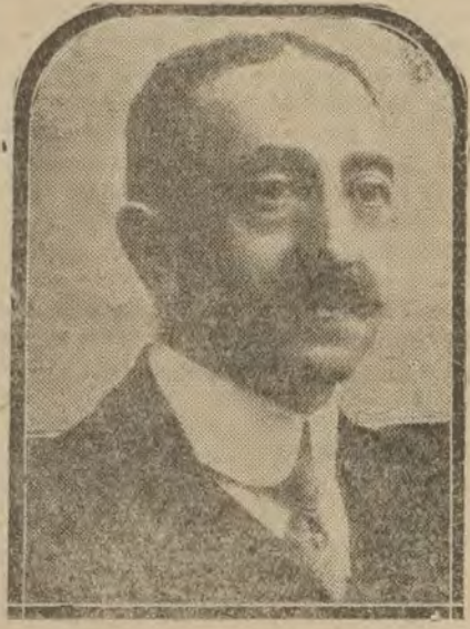
MADRID.—D. Manuel Argüelles, nuevo ministro de Hacienda