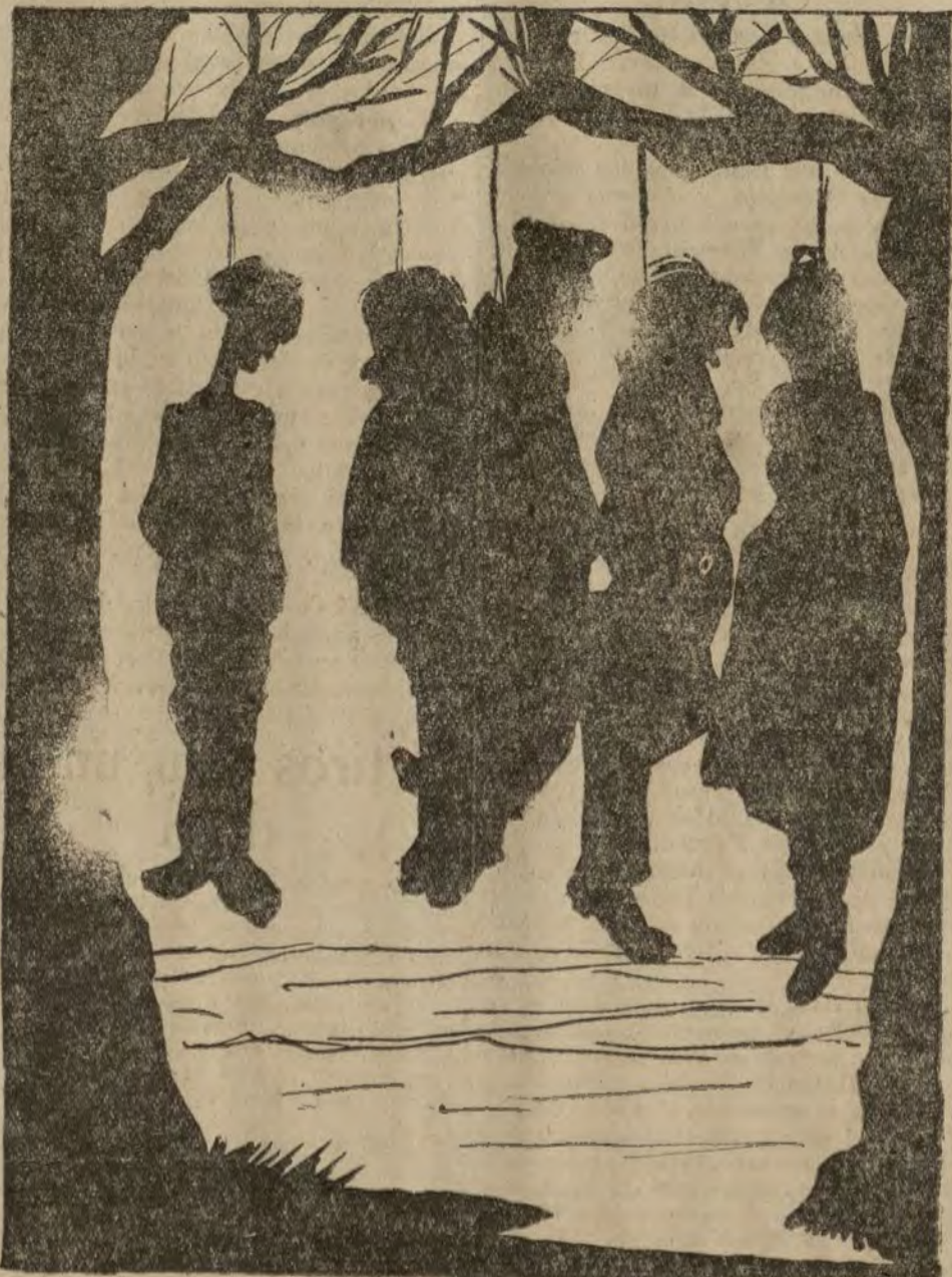
La elevación del pueblo en Rusia.

El marqués de Colonia también ha cedido a sus braceros gran parte de sus propiedades, mediante el pago de una módica renta, y les ha prometido que el año próximo repartirá las exenciones.