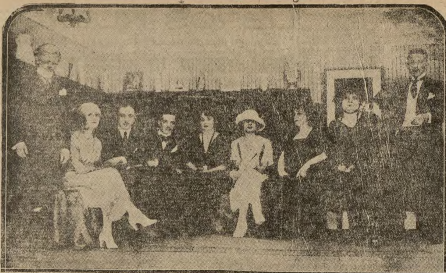
MADRID.—Una escena de la obra «Mi mujer ya está en casa», que se estrena hoy en el teatro de la Comedia

EL ANUNCIO MAS PRODUCTIVO ES EL DE LA VALLA ANUNCIADORA de las calles ALCALA y SEVILLA Palacio en construcción del BANCO DE BILBAO Más de 200.000 personas lo leen diariamente Concesionario: P. MARTINEZ OROZCO Plaza de Canalejas 6, 1.º piso