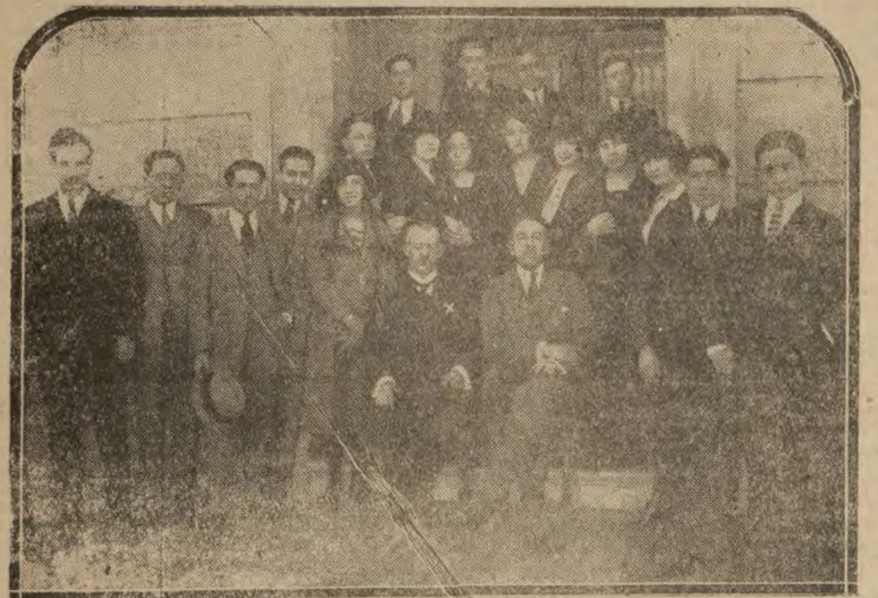
MADRID.—El sábio catedrático D. Odón de Buen (x), en la excursión científica que ha realizado con varios de sus discípulos por Córdoba, Granada y Málaga.