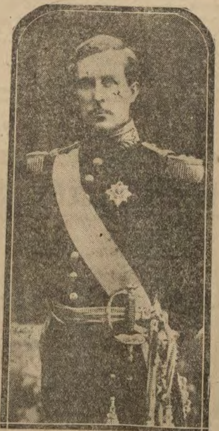
El Rey Alberto de Bélgica