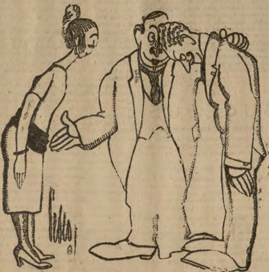
EL “INDESEABLE” PIANO

—Y alégrese usted, mi futuro yerno; esa chica sólo toca la máquina de escribir.