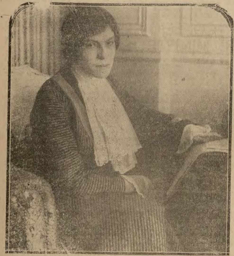
MADRID.—La eminente diva Maria Barrientos, que cantará esta noche en el teatro Real.