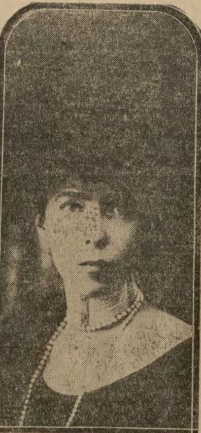
S. M. la Reina de Bélgica.