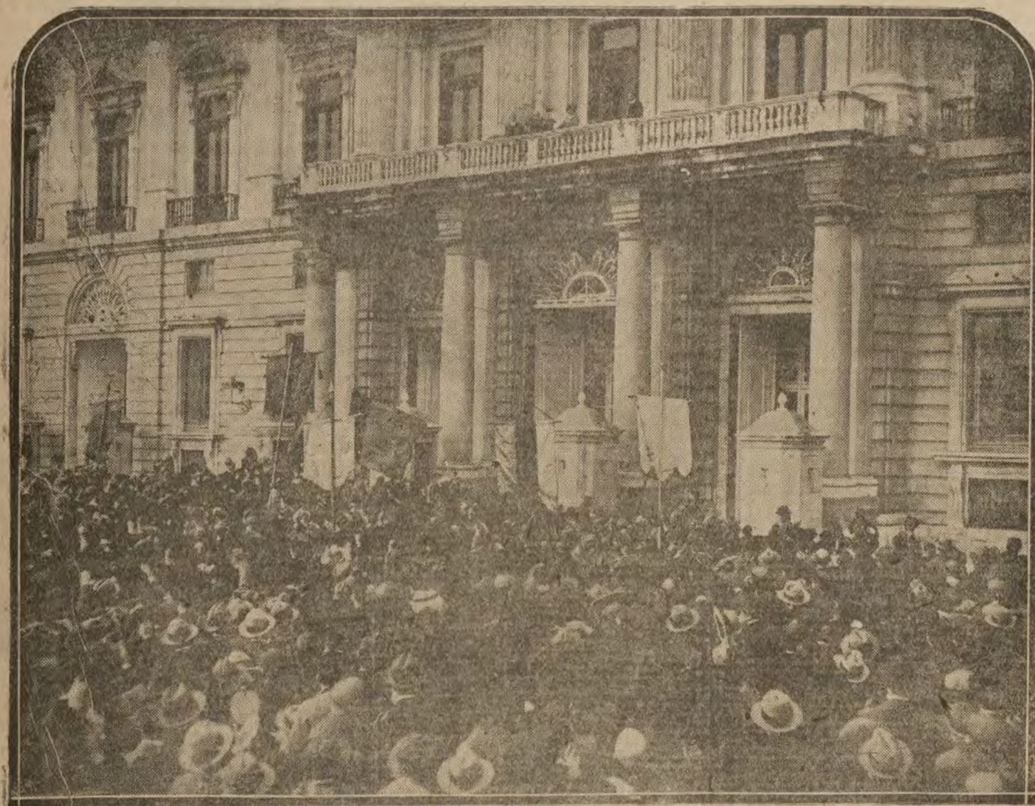
MADRID.—Los estudiantes aclamando a SS, MM, los Reyes de los belgas, frente al Palacio de Oriente.

MAQUINA PARA ESCRIBIR ROYAL TRUST MECANOGRAFICO MONTERA, 29.—MADRID