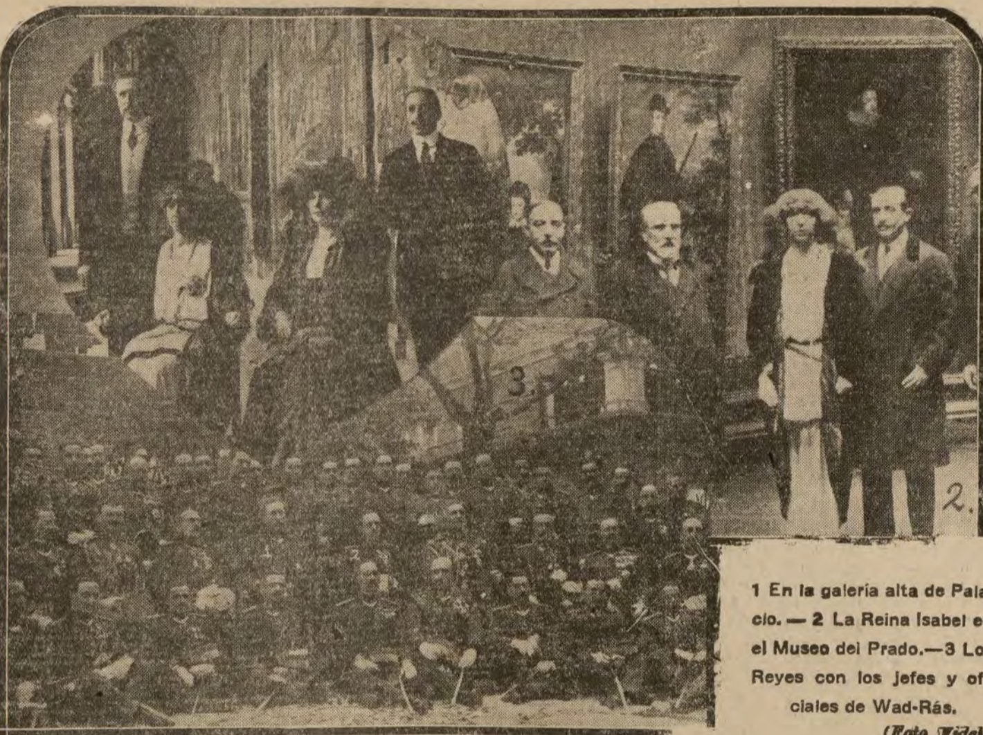
1 En la galería alta de Palacio. — 2 La Reina Isabel en el Museo del Prado. — 3 Los Reyes con los jefes y oficiales de Wad-Rás.