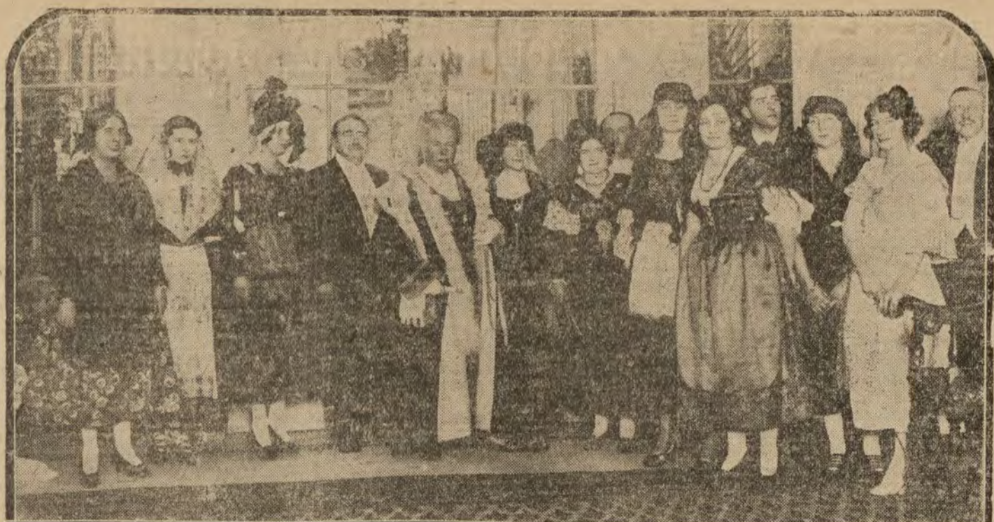
MADRID.—Del baile celebrado anoche en casa del duque de Tovar. S. A. la Infanta doña Isabel, con el duque de Tovar y aristocráticas señoras que concurrieron al baile

Casa fundada en 1899 MADRID Manuel Quesada Calzados gran novedad