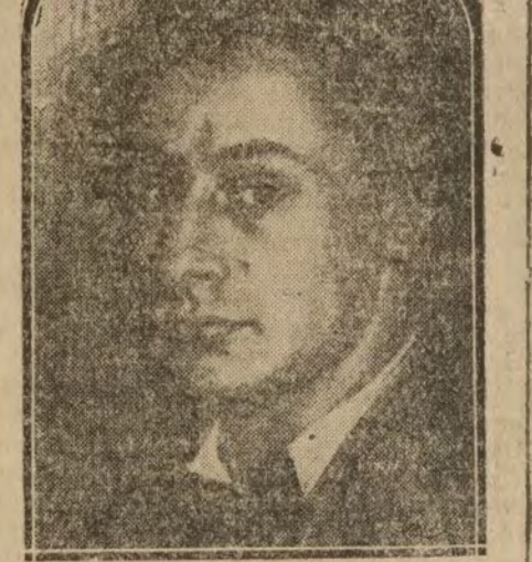
MADRID.—Autorretrato de Víctor Macho, el formidable escultor.

Unas veces es apasionado; otras, sencillo, como un hombre arcaico; otras, irónico.