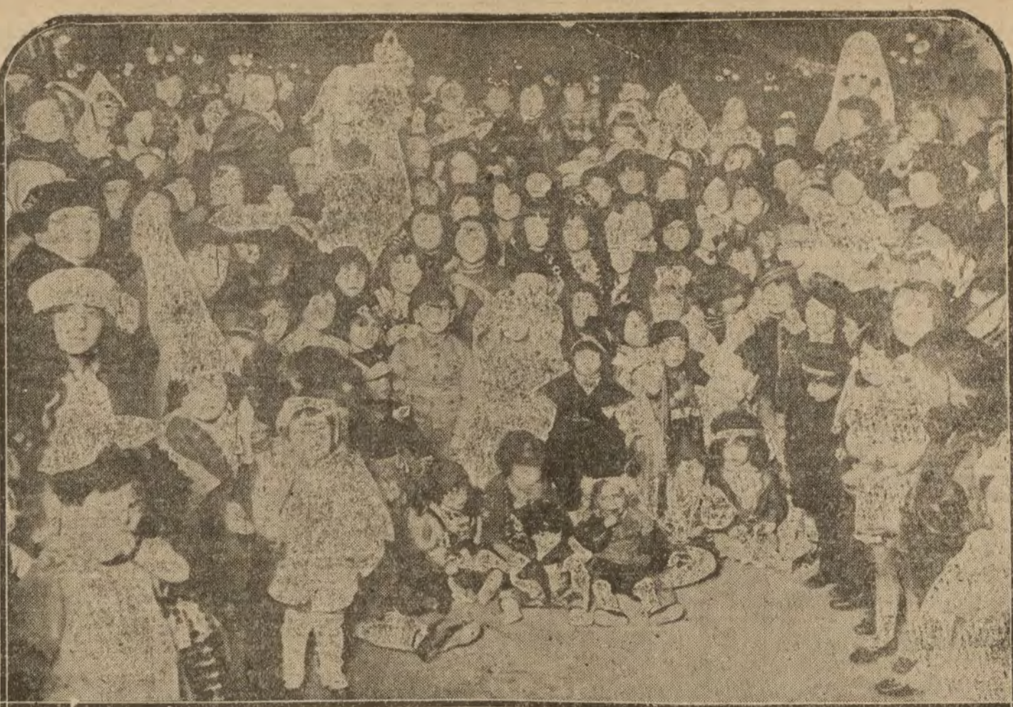
MADRID.—Grupo de preciosas criaturitas concurrentes al baile de disfraces celebrado el Miércoles de Ceniza en el Palace Hotel