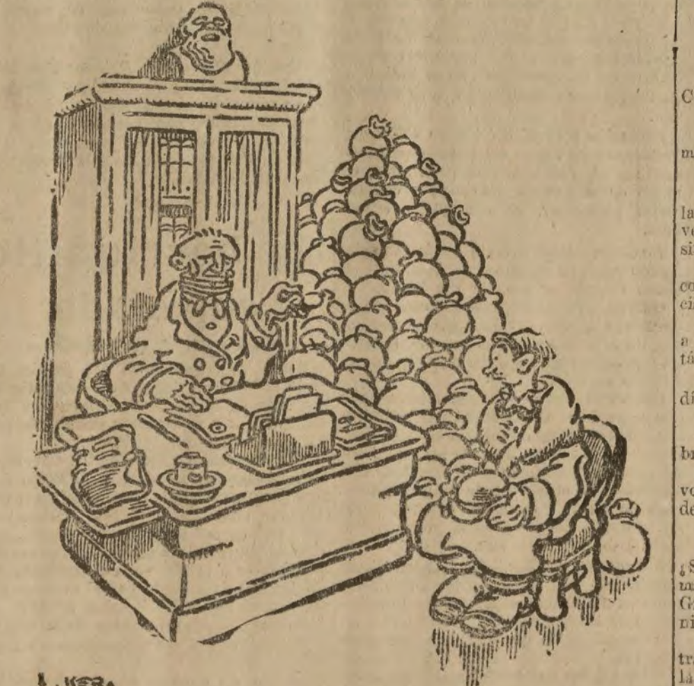
LA BUENA PRECAUCION

— Su lo, joven, no ha querido heredarle a usted... Pero no ha convertido toda su fortuna en avonos del tranvía, para que usted no haga tonterías.