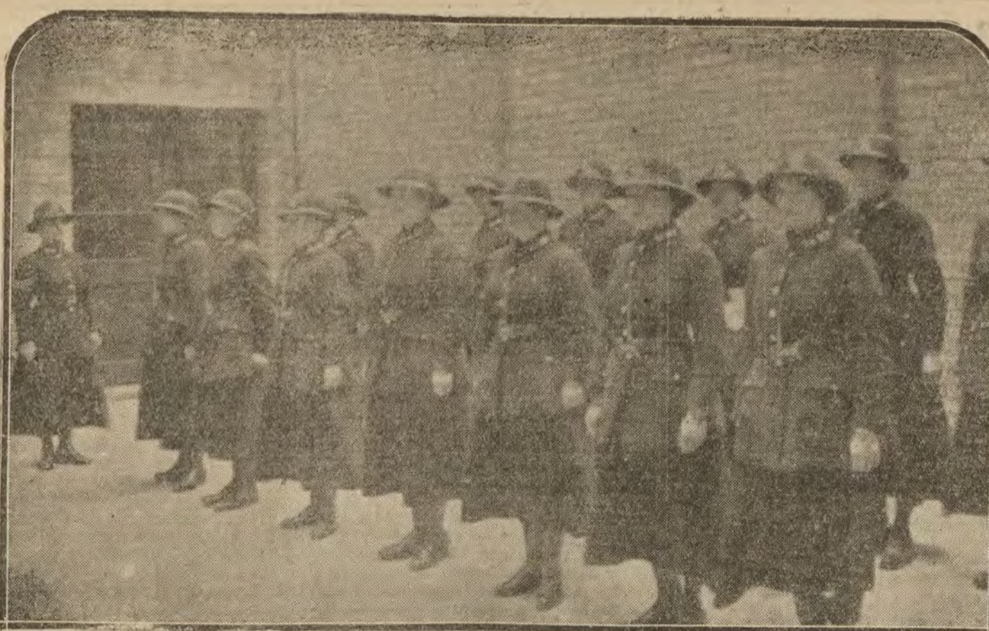
LONDRES.—Feminismo en acción. Mujeres policías eficaces, colaboradoras del servicio policiaco londinense.