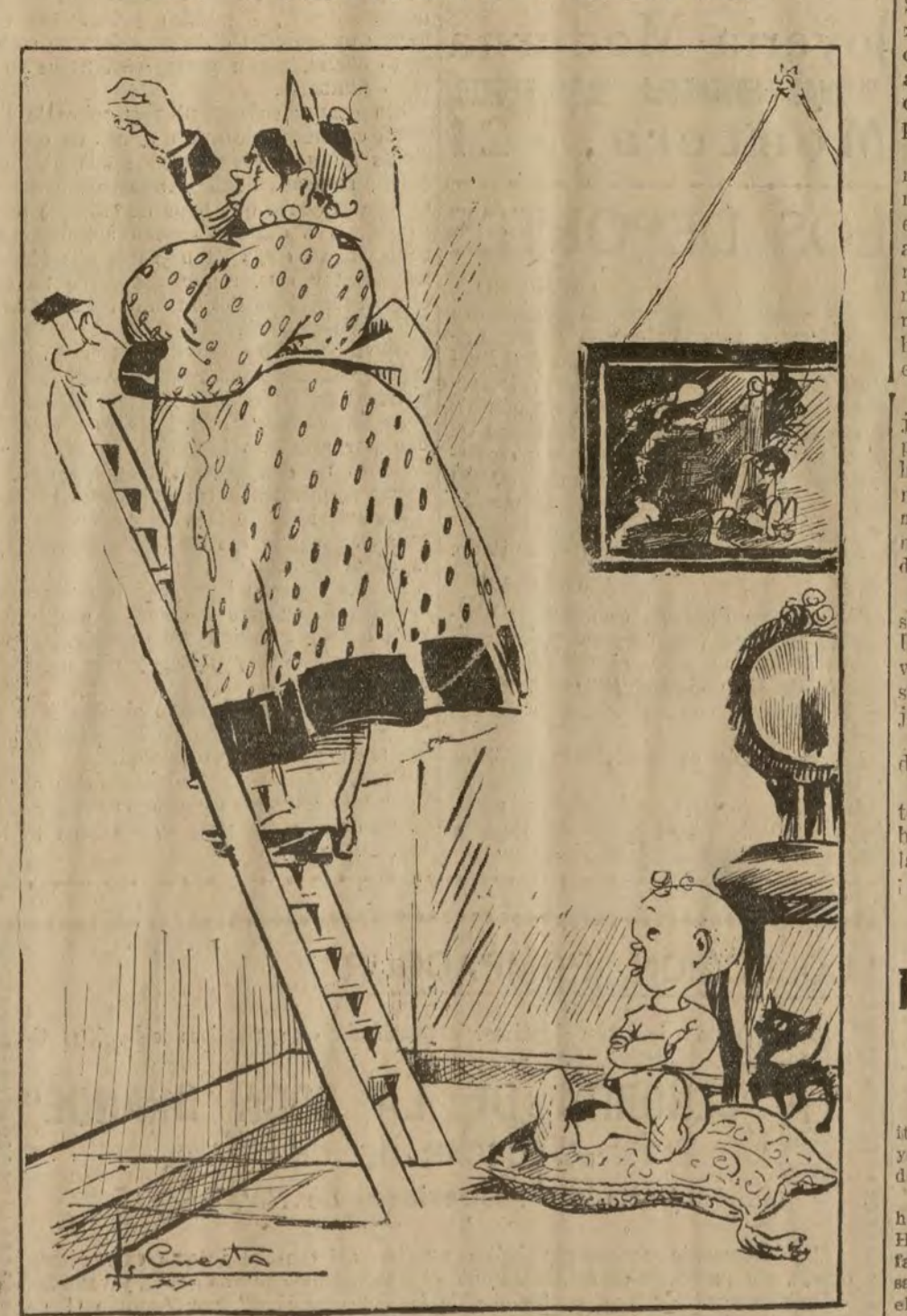
EL NIÑO.—¡Qué barbaridad!... ¡Cómo han subido las subsistencias! (Dibujo de J. Cuesca, en la nueva revista quincenal Mundo Pictórico).