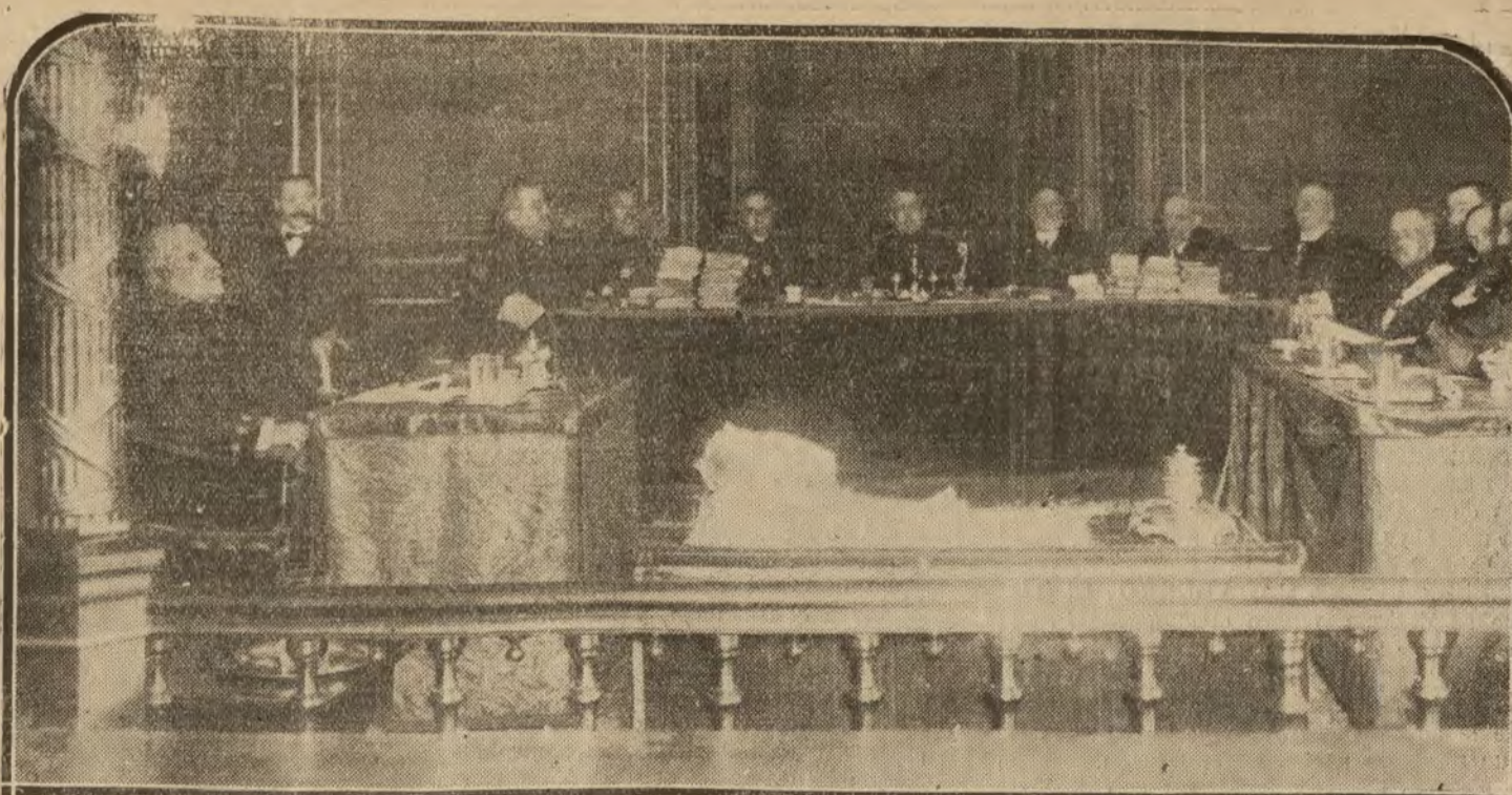
MADRID.—Presidencia del Consejo de guerra celebrado ayer en el Supremo de Guerra y Marina, por asesina- to de dos guardias civiles

construyendo por ello gran economía de precios.