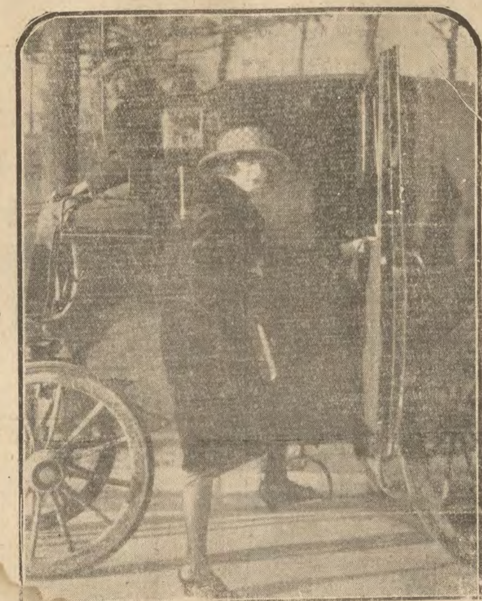
MADRID.—Ste la Margarita, tiple ligera que ayer debutó en Lara con extraordinario éxito