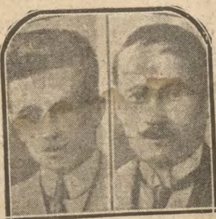
Kyriakis y Tserepis, autores del atentado contra Venizelos

El ex presidente del Consejo griego, señor Venizelos. Los acusados hicieron el retrato de su víctima en términos despiadados. Tserepis, que es un joven que parece un adolescente, de porte distinguido, explica las razones de su odio contra el hombre de Estado. Cuenta que un día recibió de Venizelos la orden de oponerse a la salida de los oficiales griegos, que quisieran ir a combatir a los albaneses. Desde que recibió esta orden, que calificó de abominable, consideró a Venizelos como un hombre nefasto para su patria. Tserepis hace en toda su disertación la defensa de la pasión patriótica; pero se le nota gran turbación cuando trata de explicar que no hubo premeditación. Kyriakis, el otro oficial heleno, se expresa en términos análogos. Durante su extensa requisitoria contra el hombre de Estado griego se oyen las palabras de "usurpador y tirano y frases como "Mi patria es la cuna de la libertad humana". "Cometí este acto para obedecer los dictados de mi honor y a la ley de mi conciencia". Luego, para realzar su responsabilidad moral, los dos acusados entaban una controversia. Ambos quieren que se les atribuya la plena responsabilidad del acto criminal. "Soy el único culpable; yo quiero que mi responsabilidad sea disimulada". Tal es el tono del diálogo. Y después de esto, continúa la requisitoria contra Venizelos.