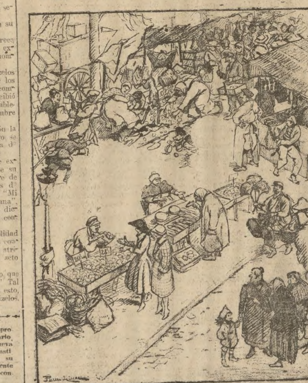
—¿Los huevos?... ¡No me hable usted!... Al precio a que están, únicamente se pueden permitir ese lujo las gallinas. (De Lisse, en "Le Rire").