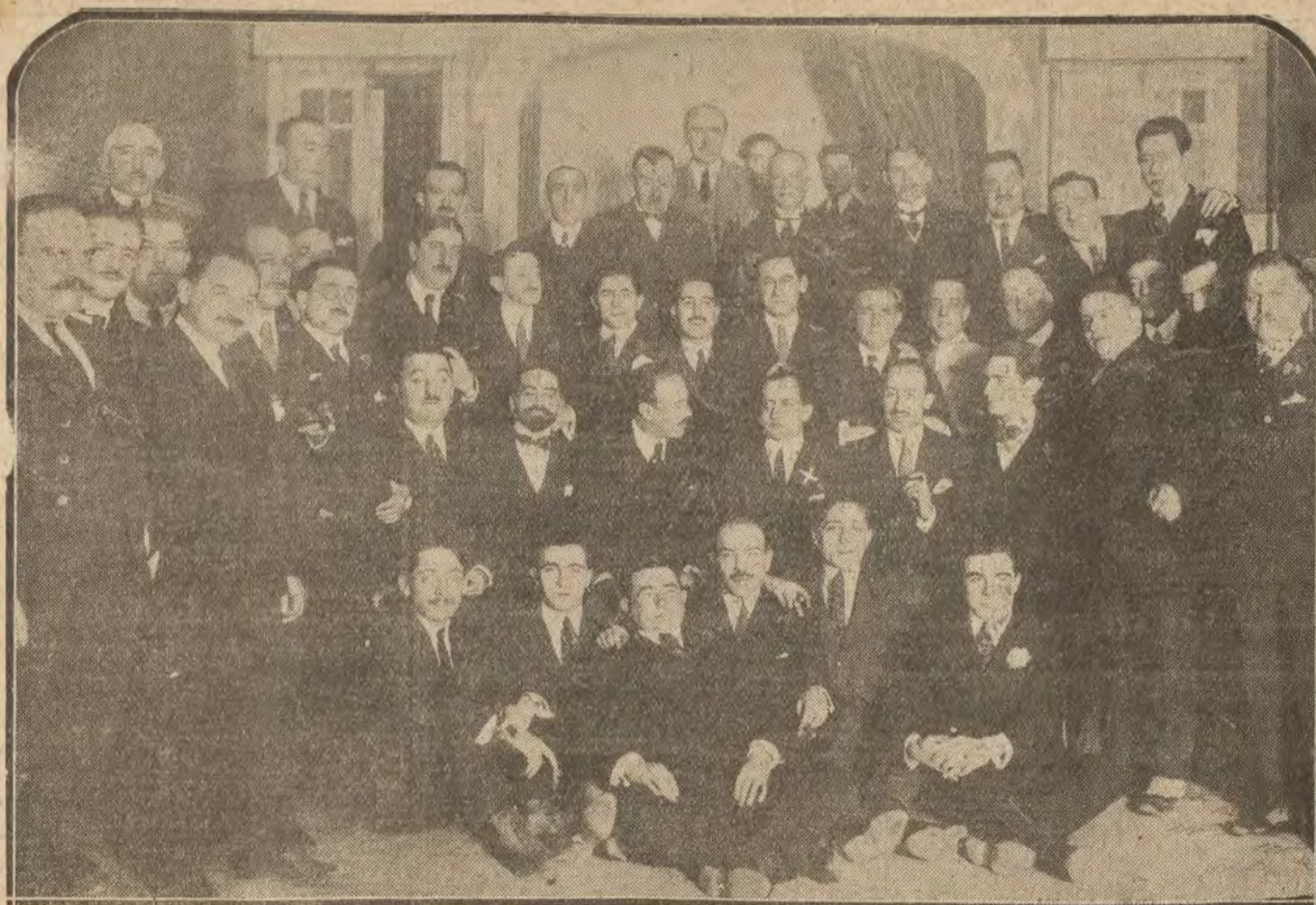
MADRID.—Banquete con que la Colonia Riojana obsequio al diputado a Cortes por Tarazona (Aragon).

Brillantes y perlas de primera, compraríamos, pagando todo su valor.