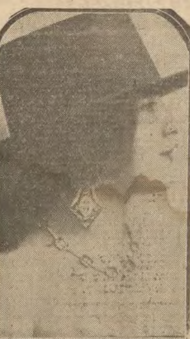
MADRID.—Señora, bellísima bailarina que ha debutado en Parisiana con gran éxito

ABOGADO.—Consulta económica, reclamos, créditos accidentales. PLAZA SANTA ANA, 10. (OCASA).