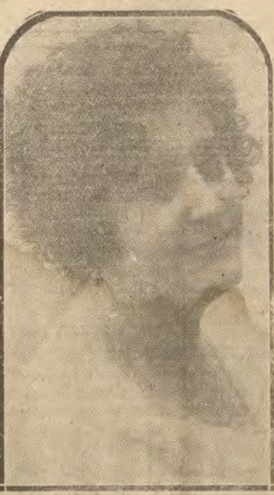
MADRID.—La bella canzonetista Isabel Senciano, que con tanto éxito viene actuando en Rómulo.