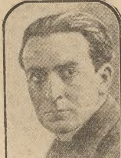
PARIS.—M. Maral Plaisant, diputado francés que ha presentado a la Cámara una interesante proposición sobre los derechos de los autores