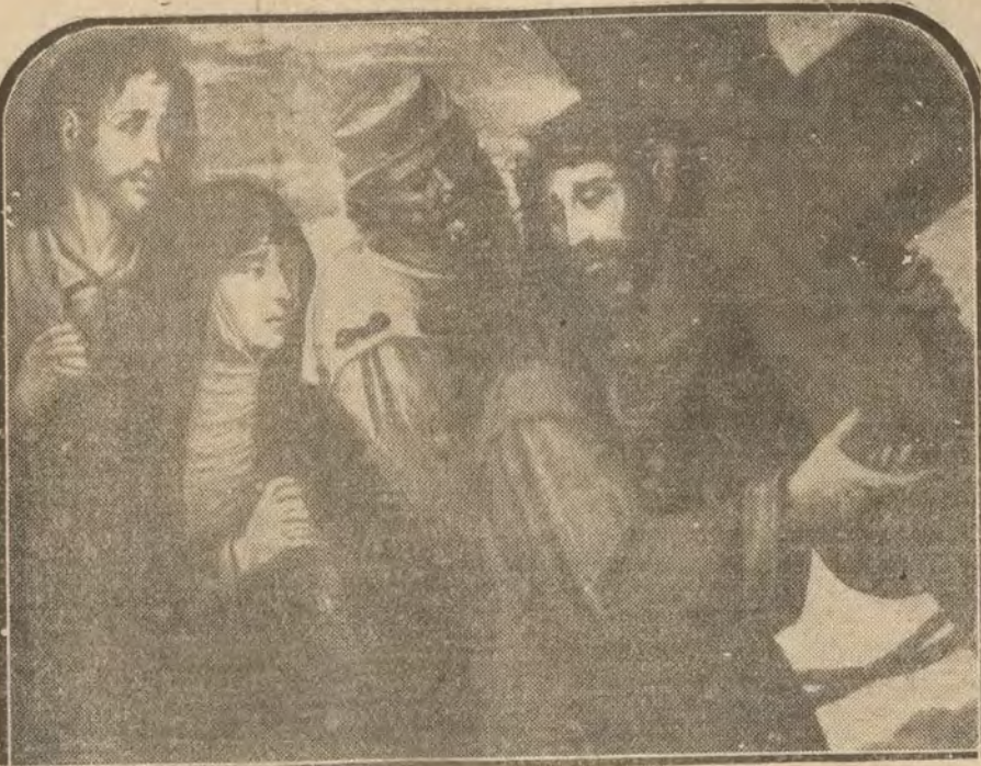
MADRID.—La hermosa obra de arte que los inteligentes atribuyen al Greco en su primera época, cuando se le confundía con el Tiziano. El original mide 195 por 95 centímetros. Este cuadro está en venta. Escriba a la Administración de este periódico, San Bernardo, 64; iniciales S. P. No se admiten intermediarios.