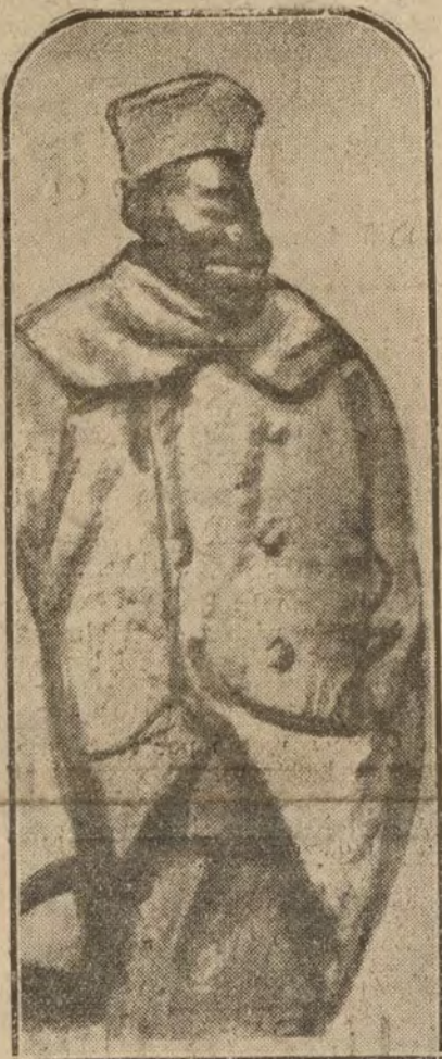
Ante la posibilidad de una nueva guerra no faltan hombres cuyo rostro expresivo reposa satisfacción.