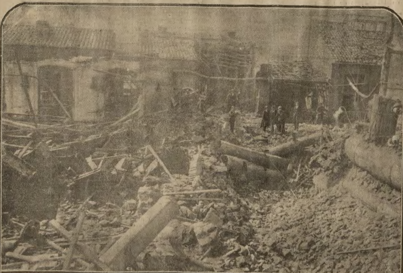
BARCELONA.—Explosión de una caldera en la fábrica de aprestos del señor Routier, que ocasionó tres muertos y muchos heridos.