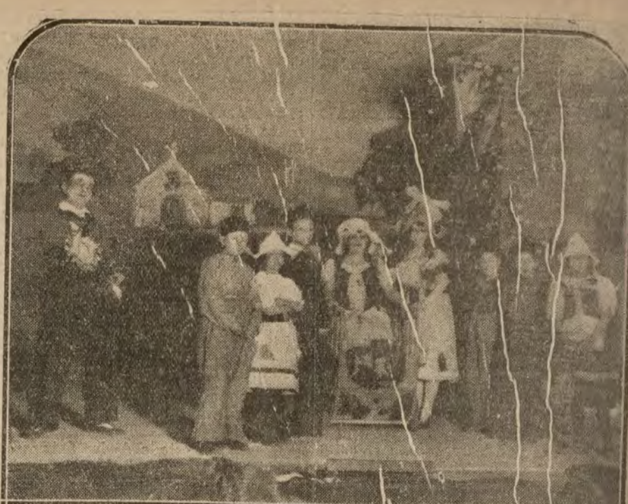
MADRID.—Una escena de «La amazona del antifaz», ópera que se ha estrenado esta tarde en el teatro de Apolo.