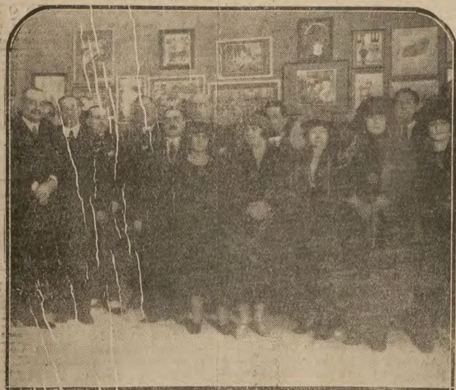
MADRID.—Inauguración del VII Salon de Humoristas