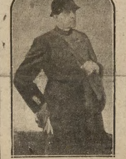
Y el padre que, en el descanso de la gran batalla, recordaba su hogar.

Y la fórmula que adoptarán para remediar estas calamidades puede ser otra guerra y a aquellos millones perdidos y a aquellas vidas arrancadas y a aquellas hambres y a aquellas miserias pueden sumarse más hambres y más miserias y más