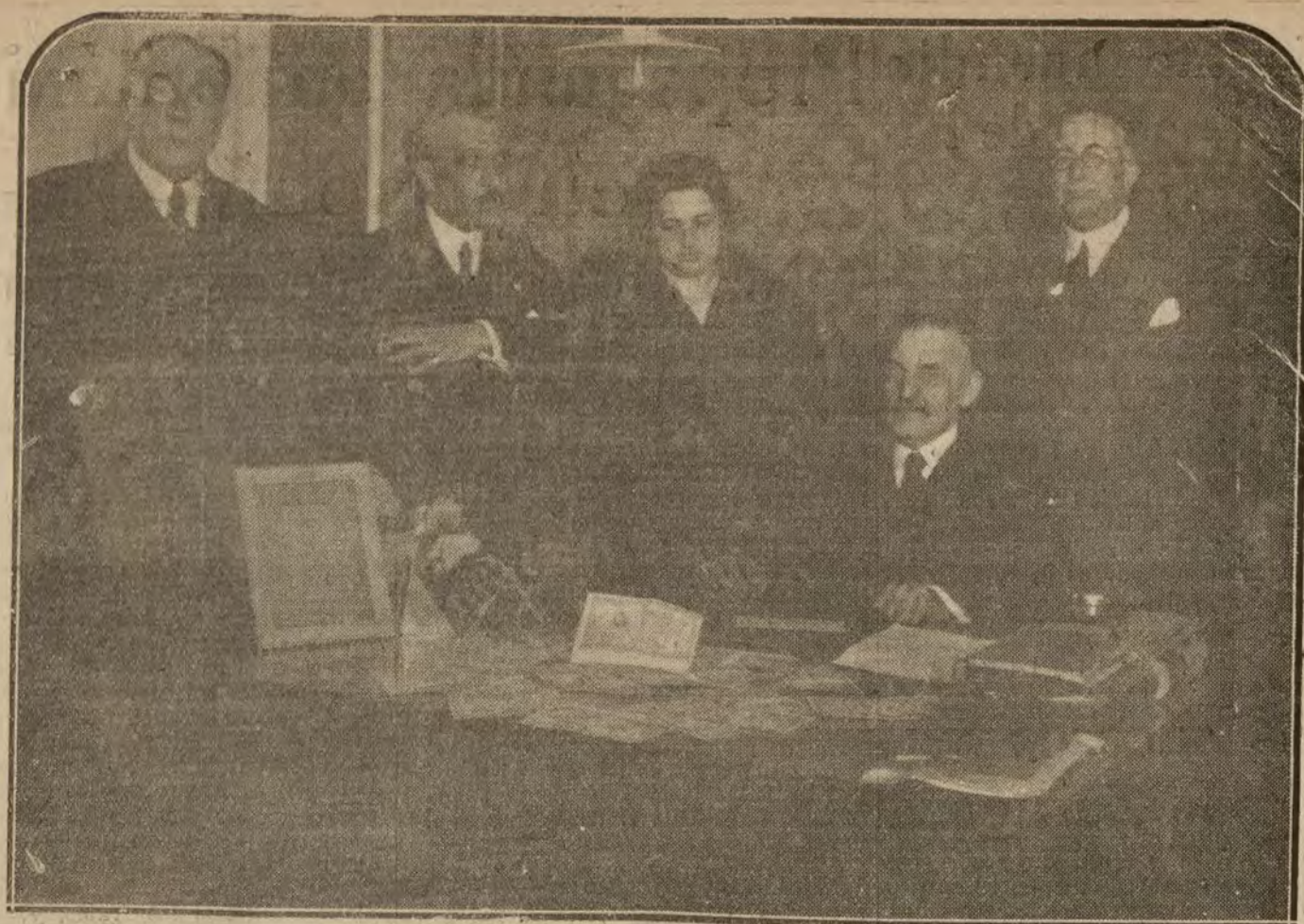
SAN SEBASTIAN.—Los agraaciados con el «duro» de Navidad, coprando los anhelados millones