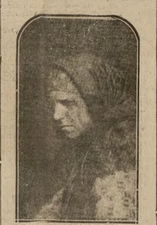
Y la madre que lloró la ausencia de aquel hijo.

Todavía viene de Austria, como dolorosa reliquia de la guerra europea, noticia de niños que se mueren de hambre. Son hijos de los héroes de la contienda de aquel soldado desolado que al haber