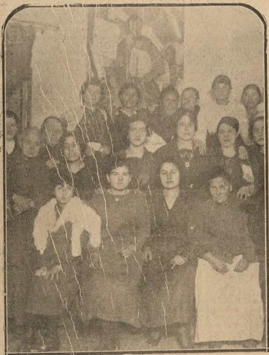
MADRID.—Grupo de asociadas de la sociedad de vendedoras «El Progreso», que inauguraron ayer su casa social