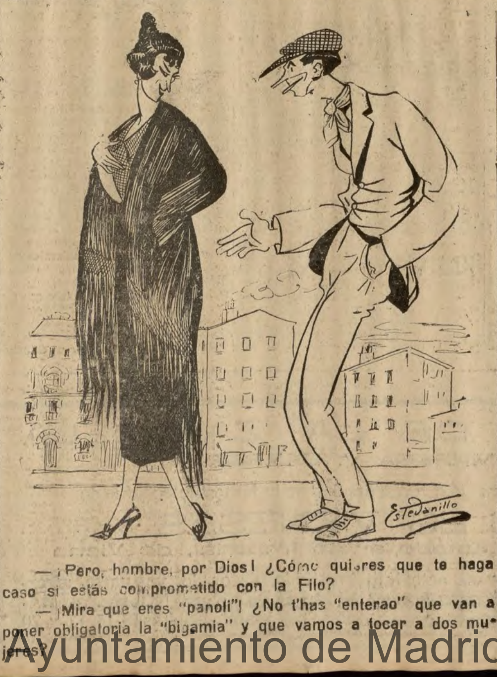
—Pero, hombre, por Dios! ¿Cómo quieres que te haga caso si estás comprometido con la Filo?

El jefe antibolchevique, Antonoff, a la cabeza de 50.000 campesinos armados, es dueño de Ronev y Tombov, cortando de este modo la comunicación entre la Rusia del Norte y la del Sur.