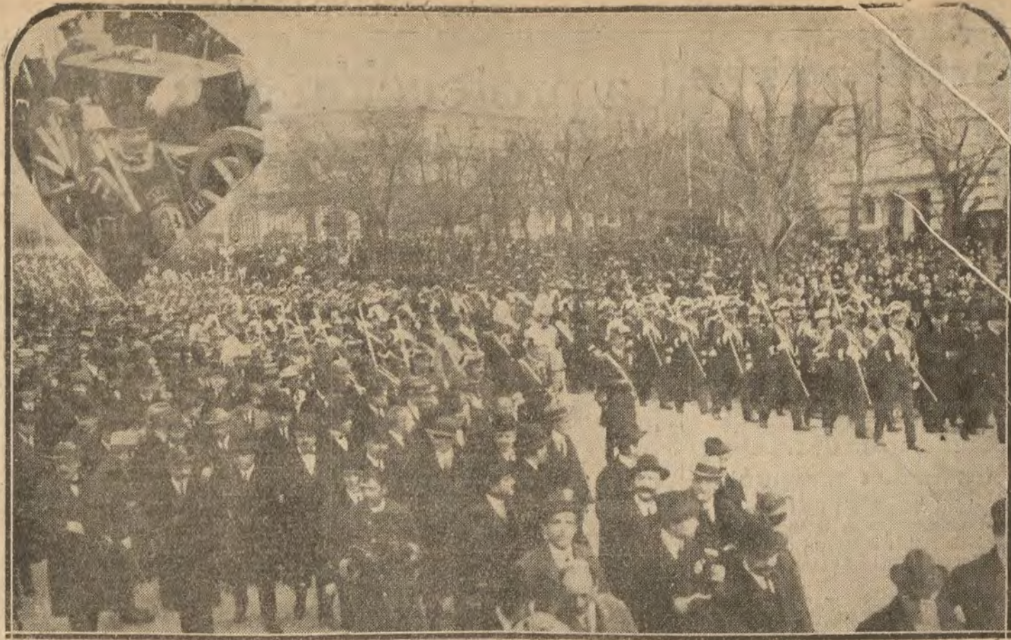
El entierro del presidente del Consejo. Numerosa pública que formó una imponente manifestación de duelo. En el ángulo, el féretro.

Casa fundada en 1889. MADRID. Manuel Quesada. Calzados gran novedad.