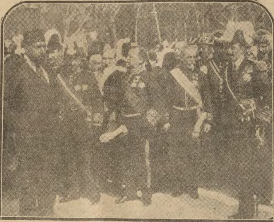
S. M. el Rey y la presidencia del duelo en el entierro del señor Dato.