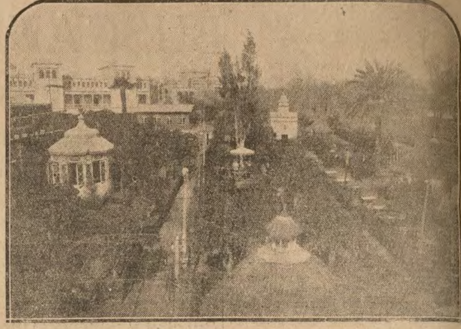
VENTA ERITANA.—Vista general del restaurant, jardín y quioscos de la popular venta sevillana.