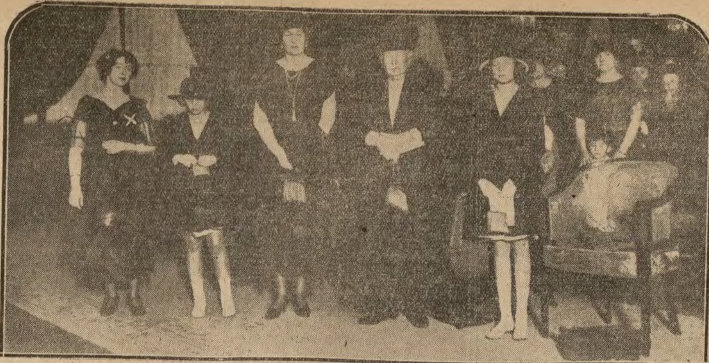
MADRID.—La Reina dona Victoria, sus augustos hijos y la Infanta Isabel al terminar el concierto dado en el Palace Hotel por la notable pianista Peezenick (x)