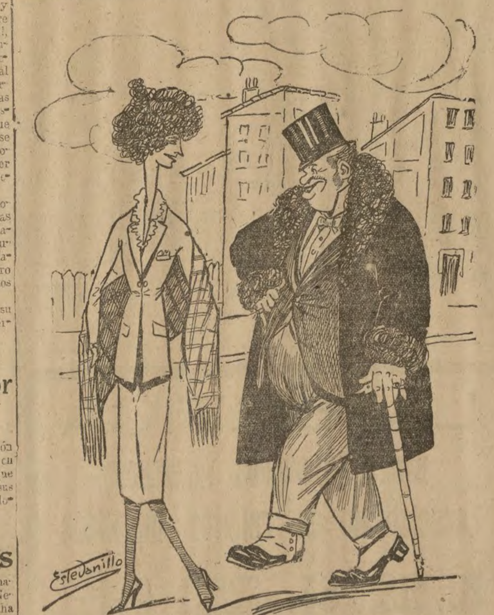
— Por usted soy capaz de pasearme por Madrid en "moto" y con un "Kodak" debajo del brazo.

¿ALLENDSSALAZAR? ¿MARTINEZ ANIDO? ¿ALLENDSSALAZAR? ¿MARTINEZ ANIDO? A NOSOTROS SIEMPRE NOS SALE MARTINEZ ANIDO.