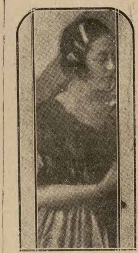
MADRID.— Gloria del Ebro, notable cancionista que está obteniendo grandes éxitos en el teatro de Fuencarral.