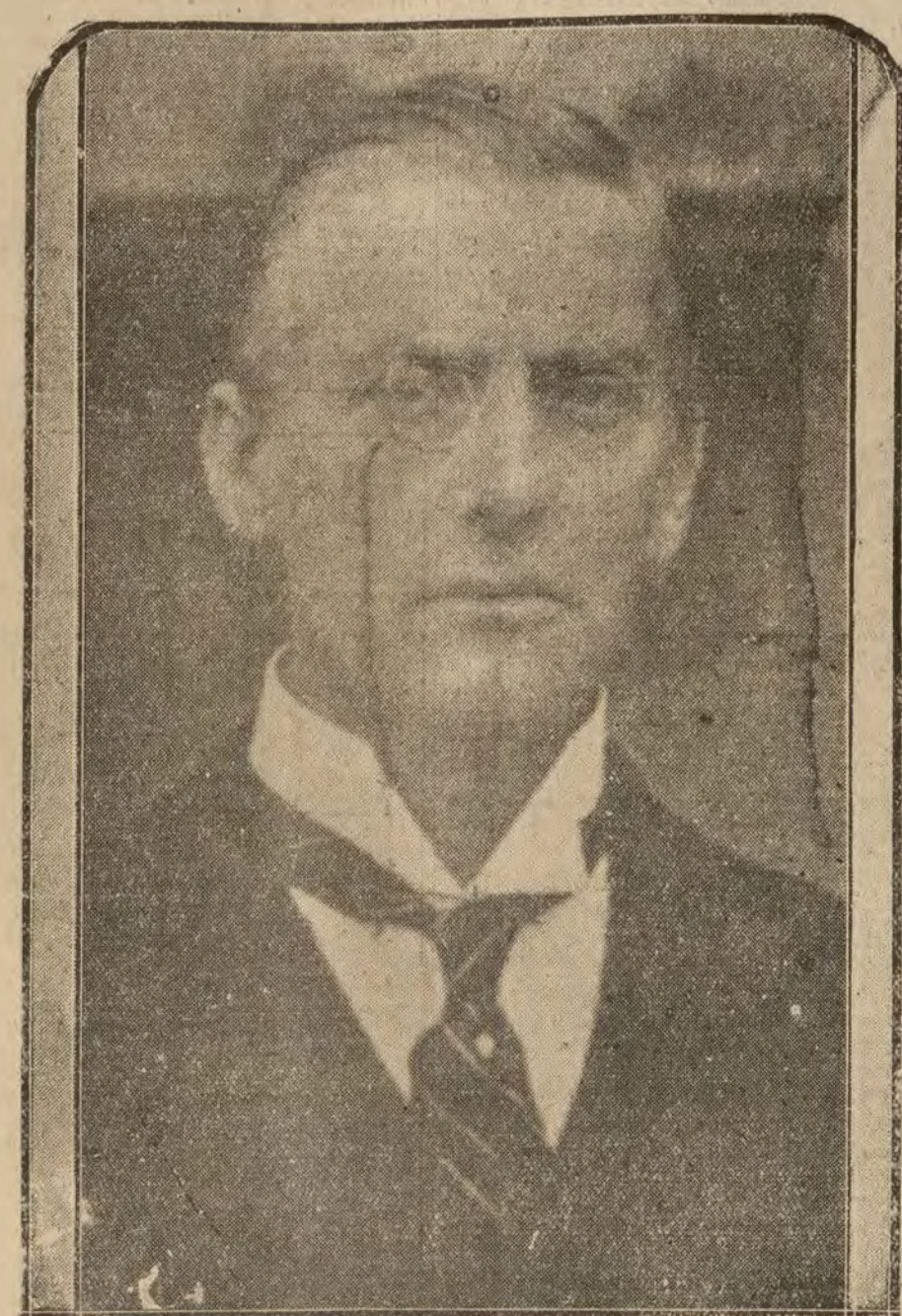
LONDRES.— Mr. Chamberlain, nuevo jefe del partido unionista inglés en la Cámara de los Comunes.