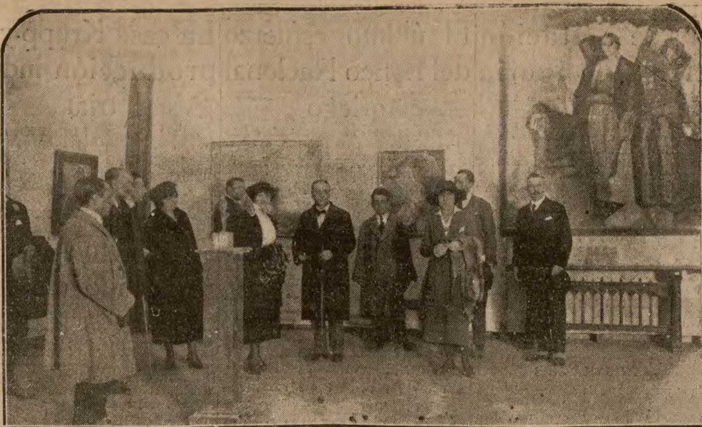
MADRID.—Bainizaje en la Exposición Vázquez Díaz