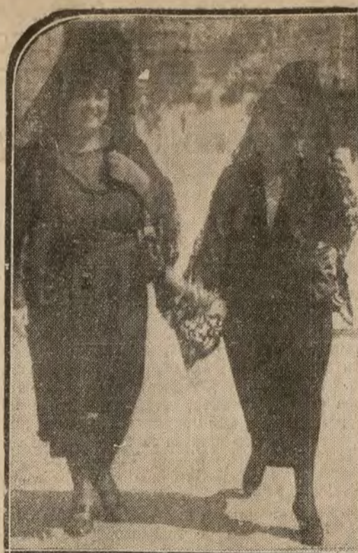
EL VIERNES SANTO EN MADRID.—La procesión del Santo Entierro celebrada esta tarde. A los lados señoritas madrileñas con la clásica mantilla.