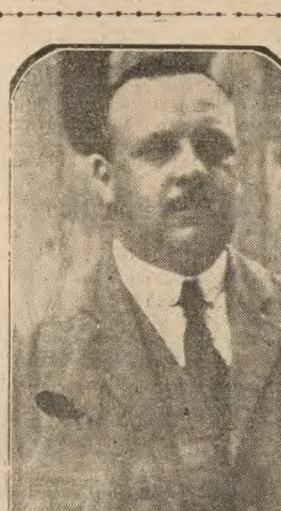
MADRID.—El diputado socialista Indalecio Prieto, de quien se aseguraba que abandonaría el Partido