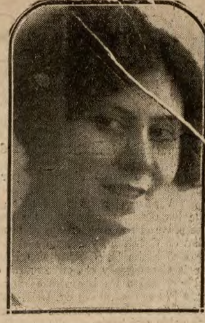
MADRID.—La notable y bella actriz Julia Lajos, de la compañía dramática española que debutó esta noche en el teatro Español