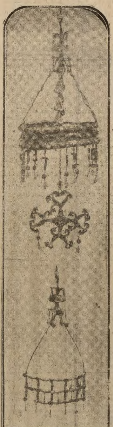
MADRID.—La corona de Surtil y el foron y trozo de corona robados de una de las vitrinas de la Armería Real

Maquinaria para toda clase de industria y agricultura, Casa española Dirección telegráfica: VICEPEREZ. Dirección telefónica: NORTE, 87-77. REFERENCIAS DE PRIMER ORDEN