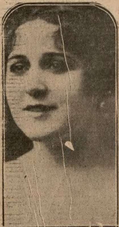
La hermosa e inzonetista Paquita Soriano, que ha realizado brillantísimas giras en América