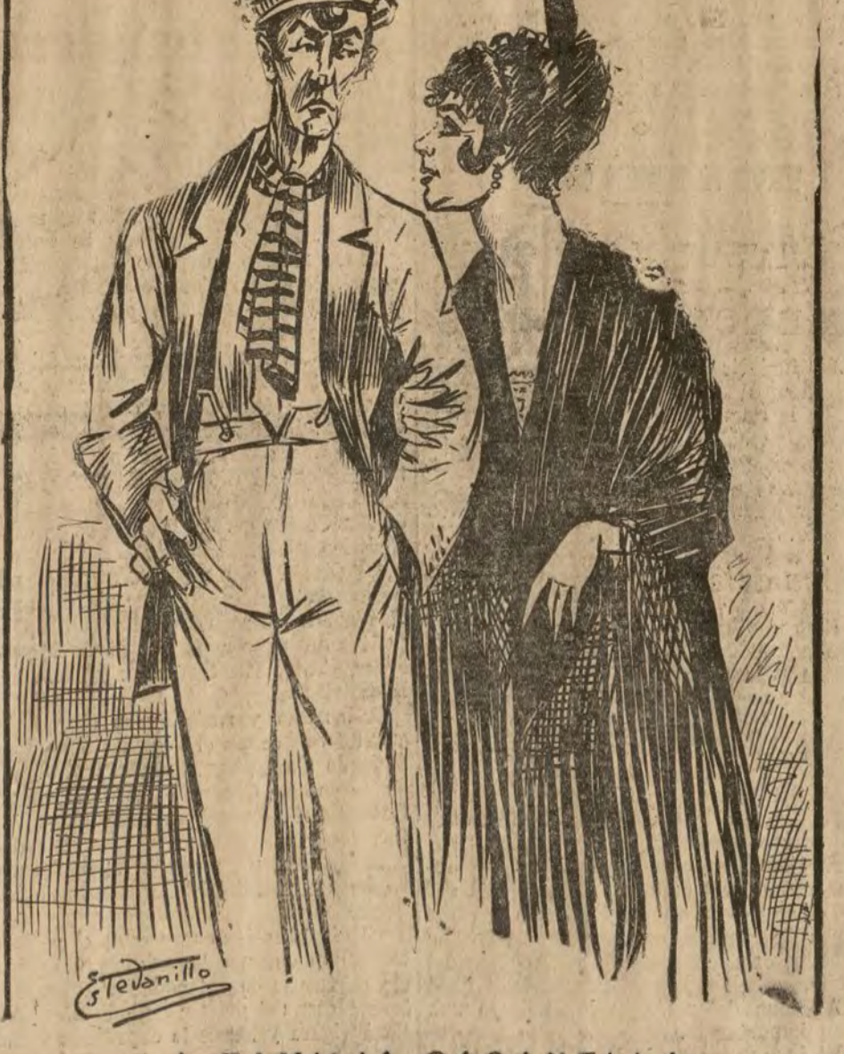
LA FAMILIA CASANELLA. Ya han delenido al padre... Si, pero lo que es al hijo. ¡Cómo no les ayude el Ayuntamiento de Madrid!

Sea muy bien venido el valiente y popular torero.