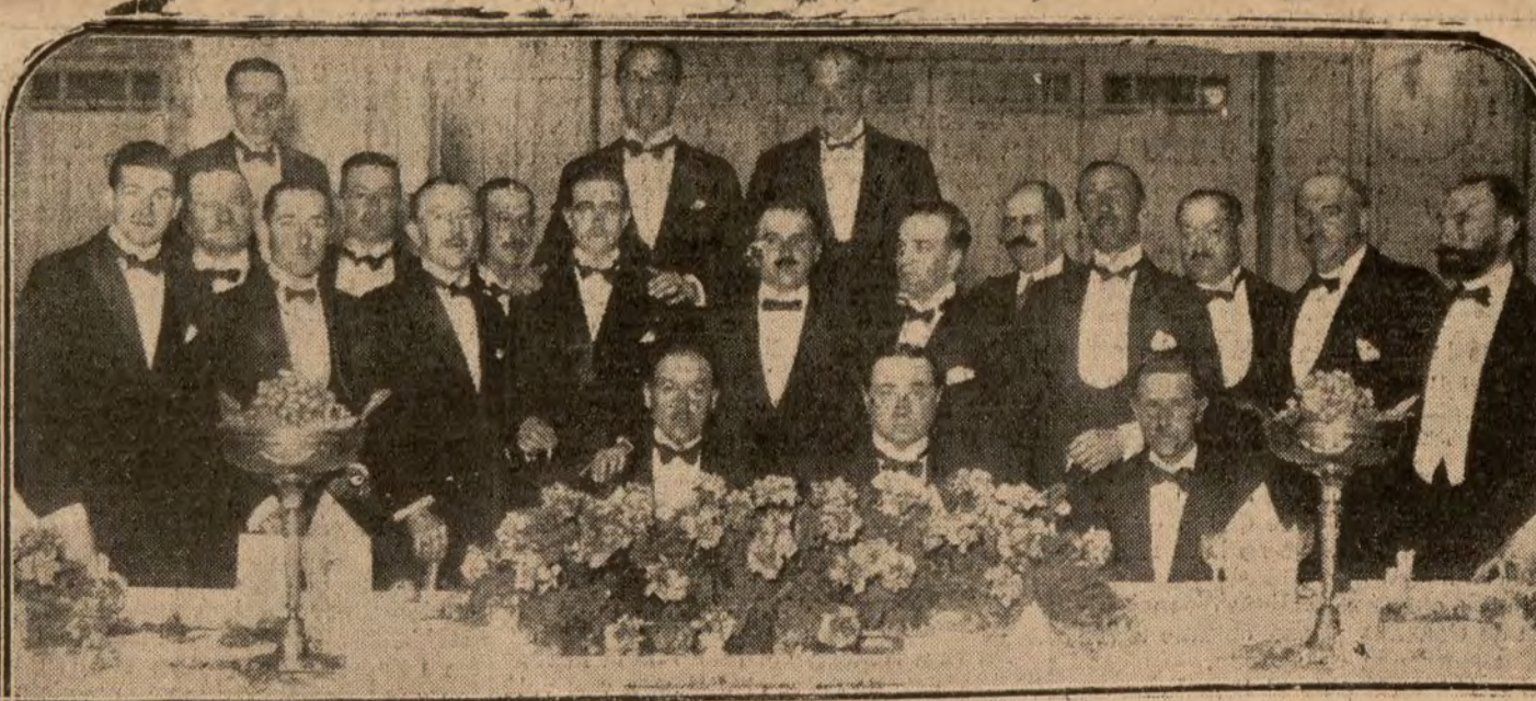
MADRID.—Banquete celebrado ayer en el Palace Hotel, por la Cámara de representantes de automóviles