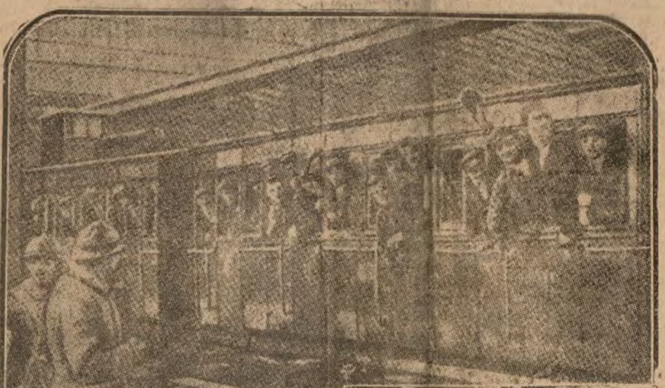
PARIS.—Salida de uno de los trenes expedicionarios en la estación del Este.

Después de la partida dolorosa de los trágicos días de la guerra, Francia ha visto partir ahora a sus soldados contagiados de esa alegría comunicativa que emana de la juventud fuerte y decidida.