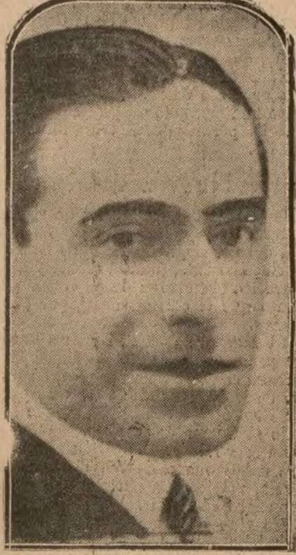
El malogrado actor García Aguiar, que acaba de fallecer en Sevilla