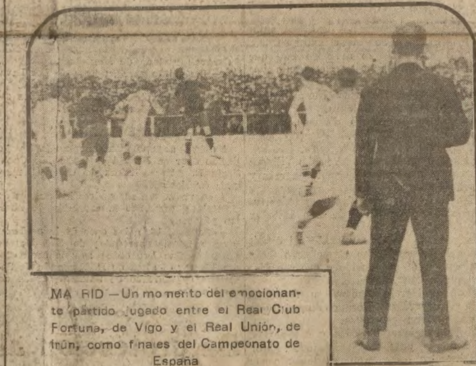
MA RÍD.—Un momento del emocionante partido jugado entre el Real Club Fortuna, de Vigo y el Real Unión, de Irún, como finales del Campeonato de España.

El doctor Simons quiere salvar a Alemania, prometiendo restaurarla internamente, para cumplir sus compromisos con la nación vencida por Molke. No es su labor más ruda, más ardua y más admirable que la de Bismarck.