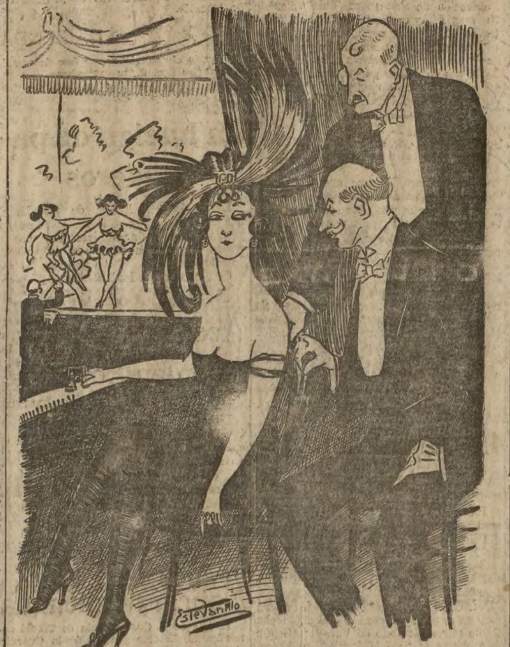
¿Qué le parece a usted esta opereta?

Unanímidad! ¿Cuándo ha existido en la Historia? Los Reyes siempre, unánimemente, han tirado a sus Tronos; pero los pueblos no han amado jamás unánimemente a sus Reyes destronados.