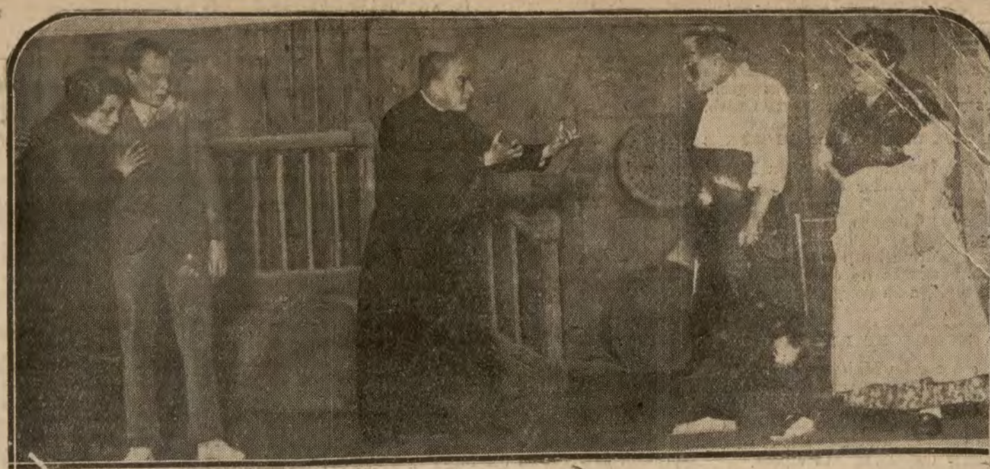
MADRID.—Una escena del drama «Padres», de Lopez Merino, estrenada ayer con éxito en el teatro Español