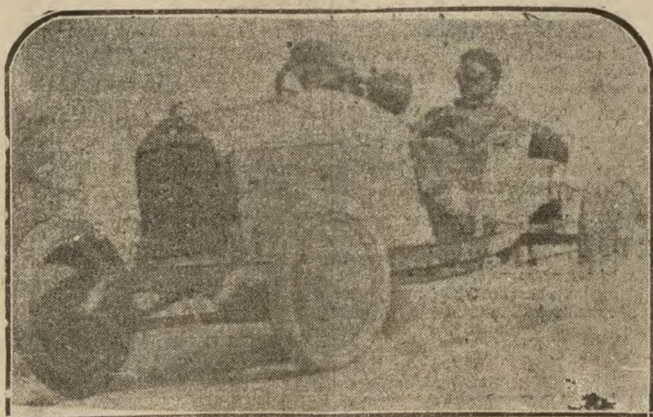
BARCELONA.—El automóvil marca «Hebe» de fabricación nacional, durante el recorrido de la cuesta de los Bruchs, en cuya carrera obtuvo la más alta recompensa.