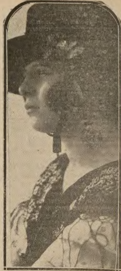
MADRID.—La bella y notable bailarina Carmen Diadema