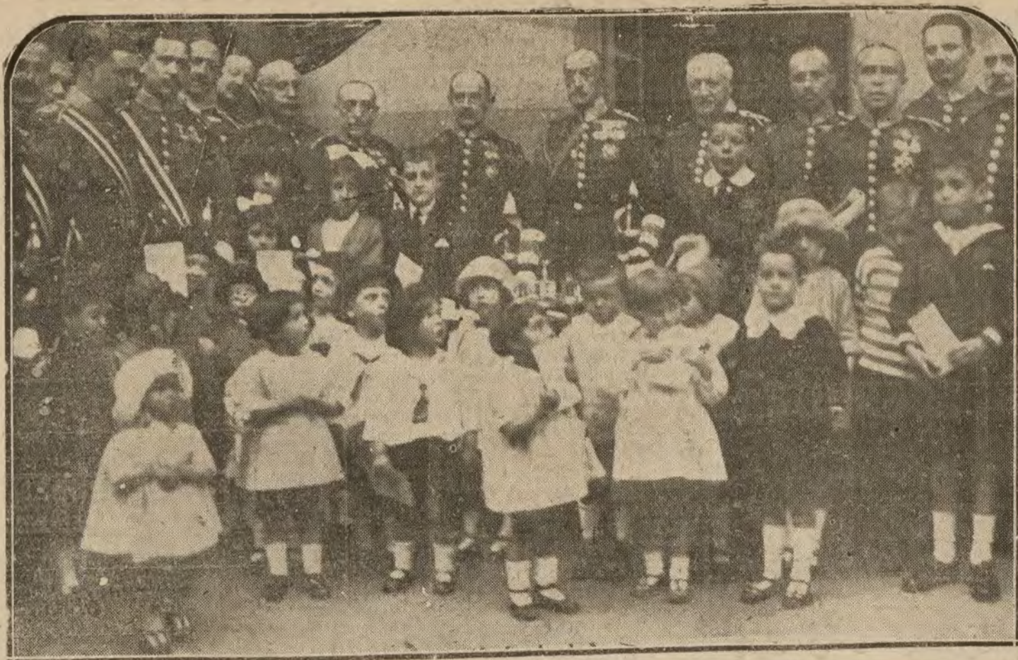
MADRID.—La fiesta de los alabarderos. Entrega de carteras de honor a los hijos de los guardias.