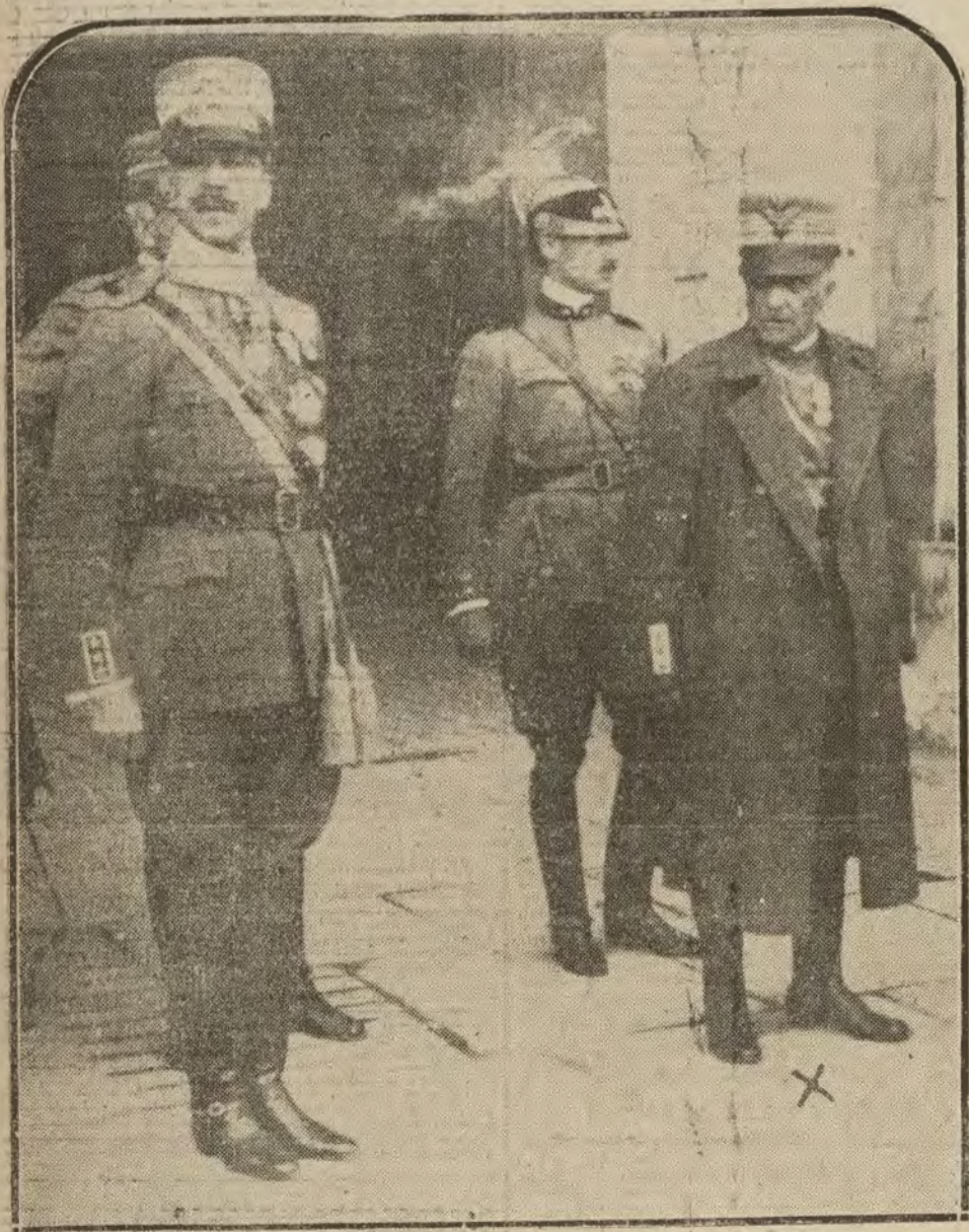
El generalissimo italiano Diaz, al salir de Palacio.